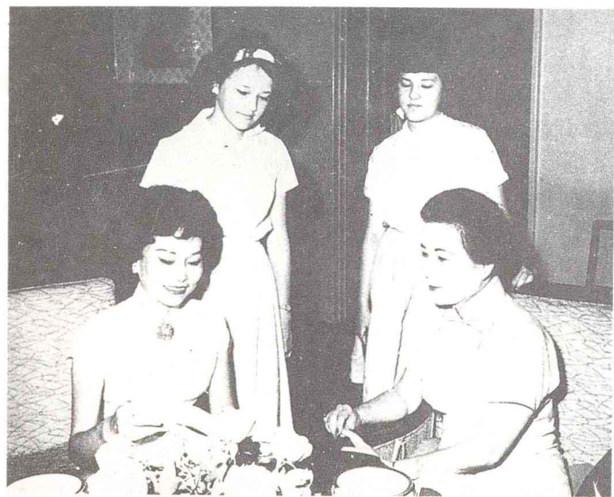
二十多年前在台北家中与蒋夫人合影