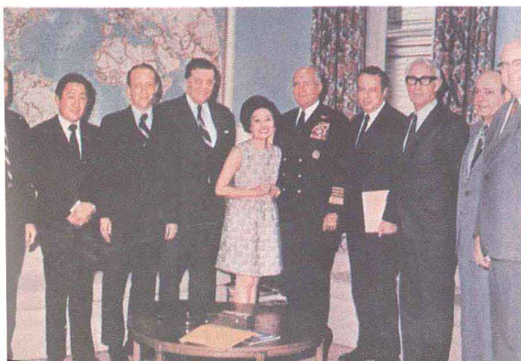
在美国 国防部长室