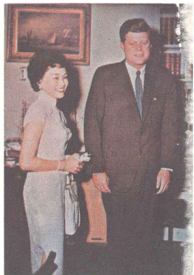
香梅与肯尼迪总统（甘乃迪） 于白宫书房