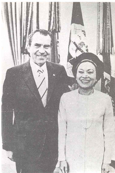
陈女士为尼克松总统至友，几番出马为尼竞选立下汗马功劳