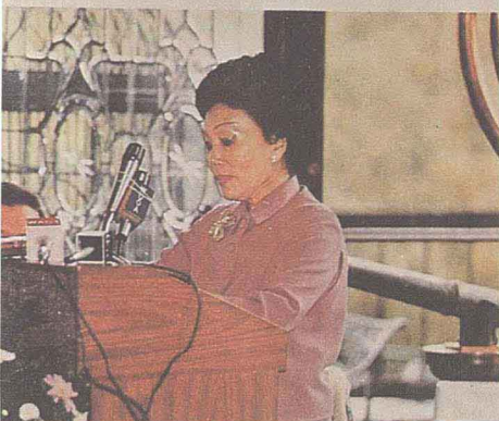
香梅在家中宴请尼克松总统阁员，右为当年的财政部甘乃迪夫妇