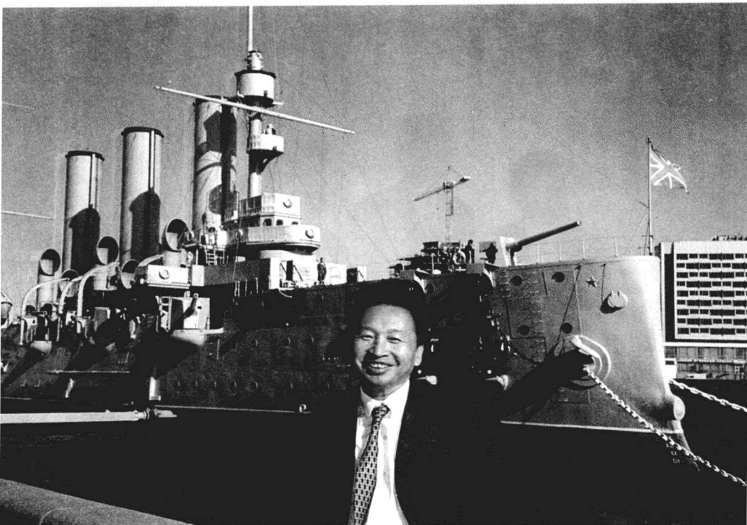
2004年9月访问俄罗斯时在“阿芙乐尔号”巡洋舰前留影