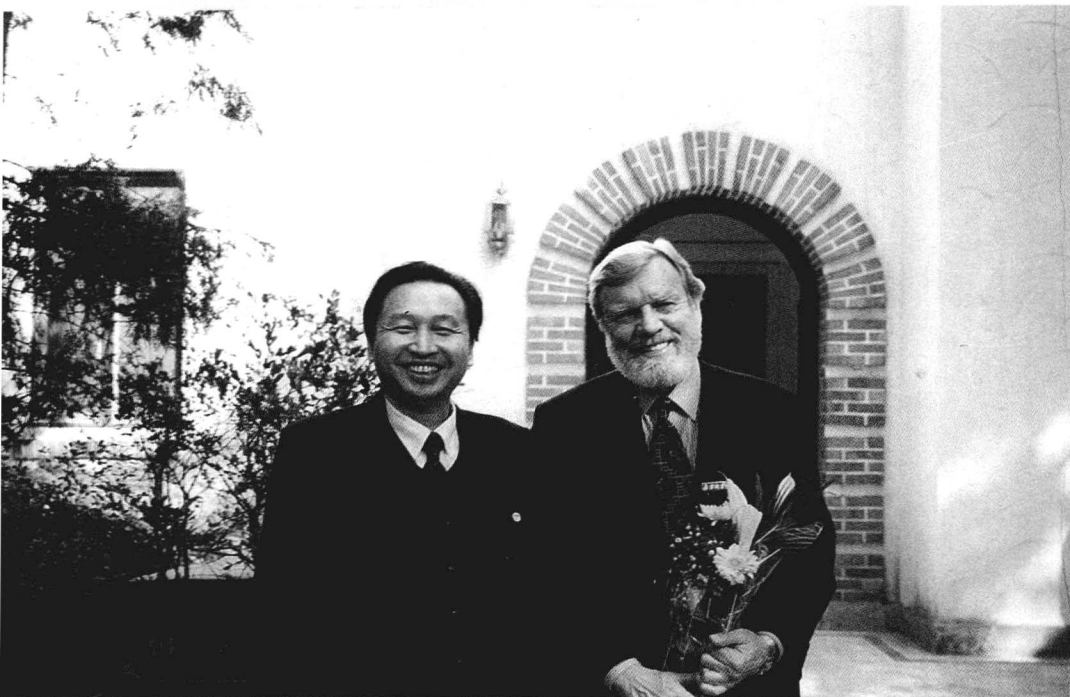
1995年11月与到访南京大学的国际著名未来学家约翰·奈斯比特合影