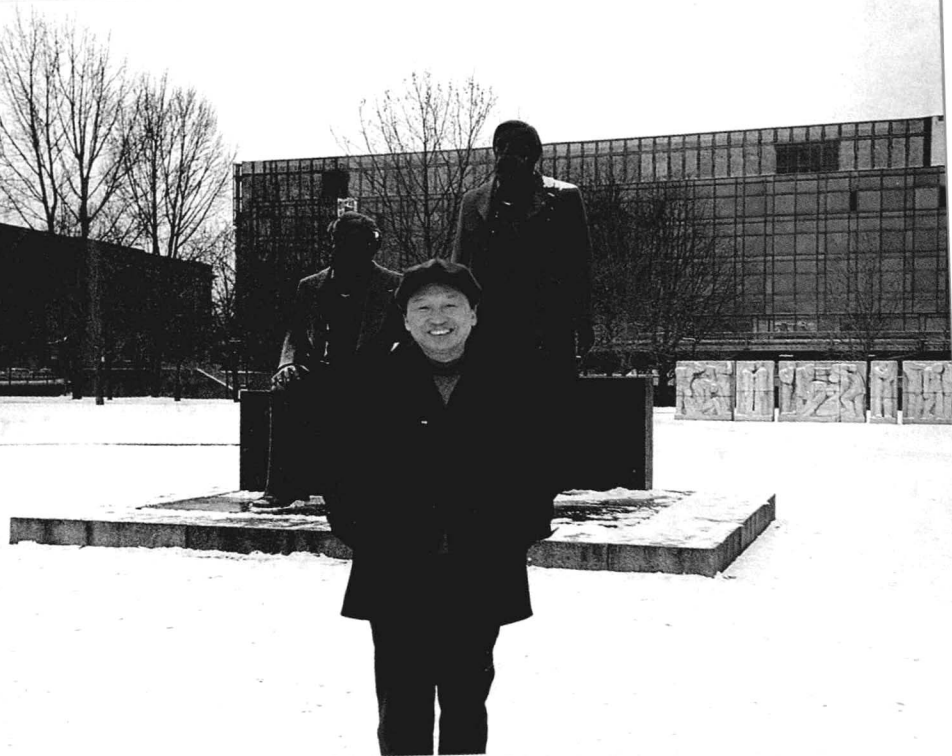
2004年9月访问欧洲期间在德国柏林马克思与恩格斯雕像前留影