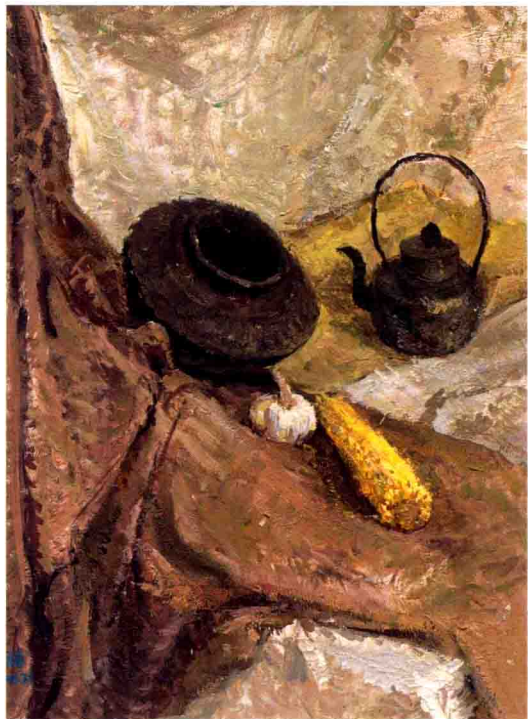
图1. 有罐子、玉米的组合静物