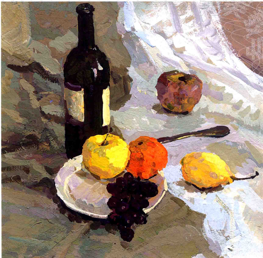
图6 有水果、酒瓶的静物组合

他塑造这些水果时同样也是用“冷色包裹、冷色串联”，但是果子地塑造稍微深入了一点，物体本身的松紧关系缺少了一点，就是说，物体放在那里有点孤立了，不是很能融进整个调子里面。