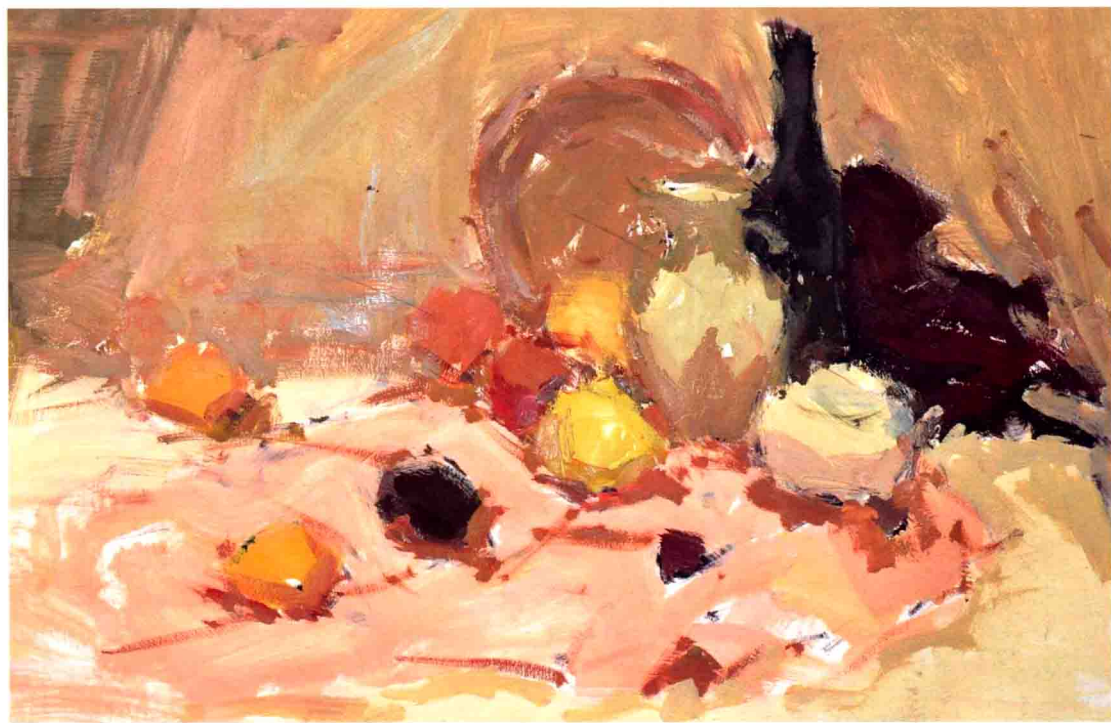
(下图) 有水果、罐子的组合静物(步骤图)

杨：还有一个关于色彩浓度的问题，北方的老师看南方的色彩，也许会觉得灰灰的、飘飘的，颜色浓度不够，比如说画水果吧，可能南方画的时候纯度各方面都在降低，有主观调整在里面，北方可能会将红色水果给足，黄色水果给足，纯布也给足……那对于色彩浓度这个问题，二位老师有什么看法？