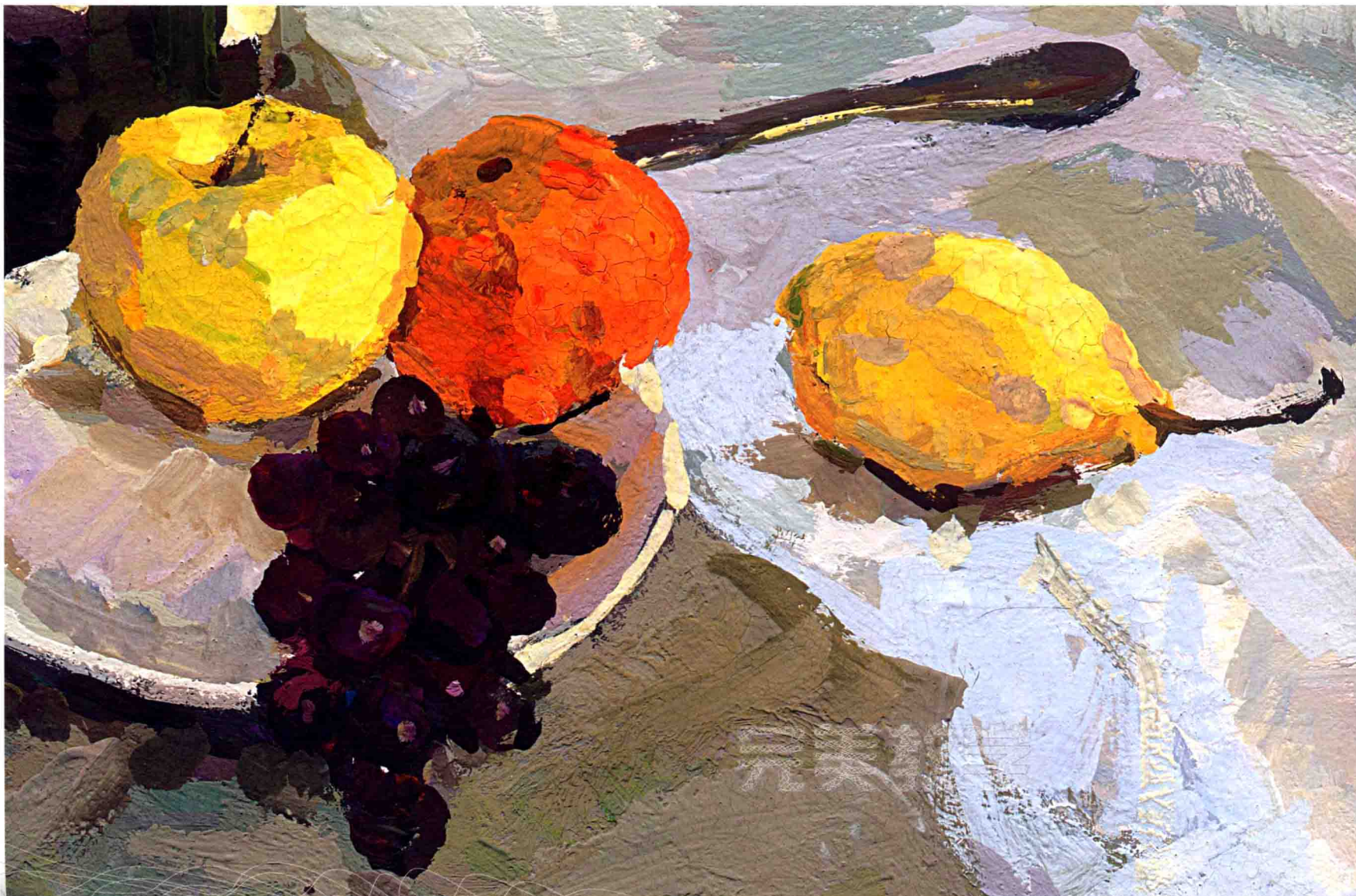
图8 有水果 酒瓶的静物组合（局部）

如果我们“理性”一点分析“热闹”跟“不热闹”的关系，会发现物体的“热闹”程度与布的“热闹”程度有一个比例在，这个比例可以灵活变动，就是说为了让画面更好看，我们在作画时会有一老取舍，这一点从用笔也可以看出来：红衬布前面竖着用笔，白衬布横着用笔，这就是“笔随象行”，用笔根据画面的动态来，这样的话作画的时候才有“气势”，作画的时候，一上来就“啪啪