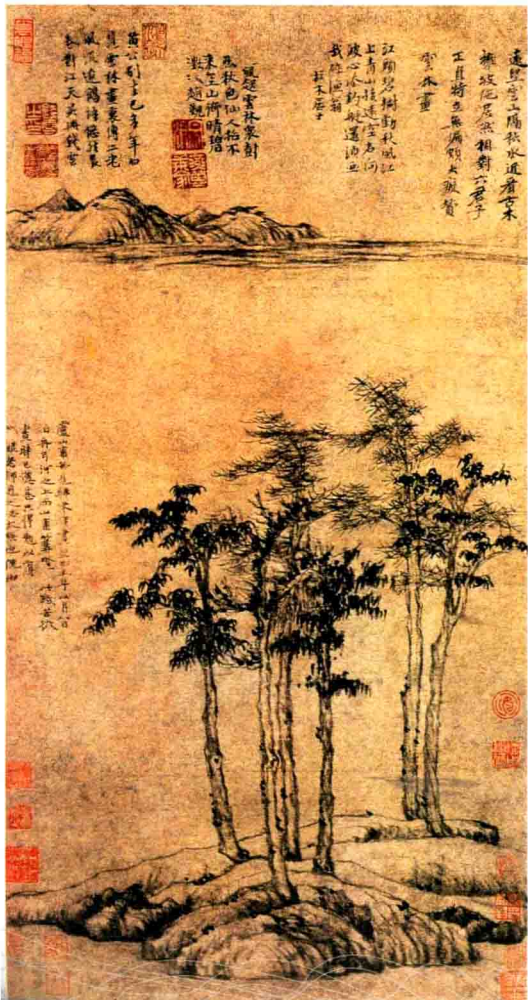
图2. 六君子图 倪瓒 (元朝) 96.1 x 46.9cm