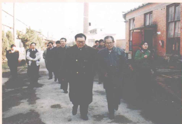
中共中央政治局常委李长春（前排左一）到漯河市水泵厂视察企业改制工作