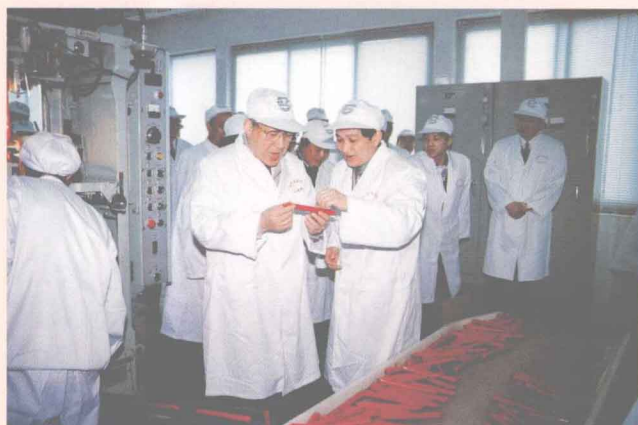
中共中央政治局常委、国务院原副总理李岚清(前排右二) 到双汇集团视察火腿肠生产情况