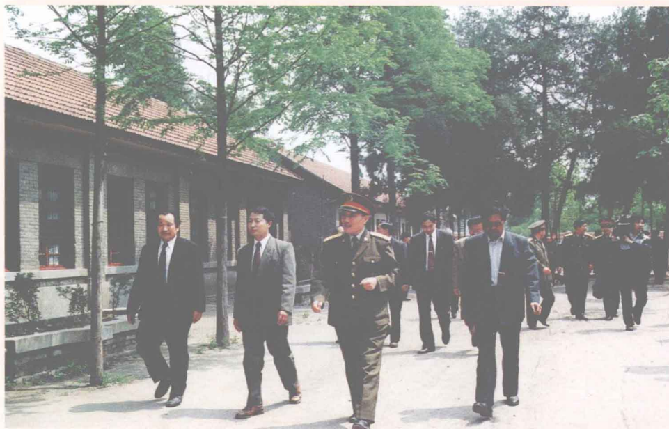
中共中央政治局委员、中央军委副主席、国务委员兼国防部部长曹刚川上将（前排左三）到母校漯河一高视察