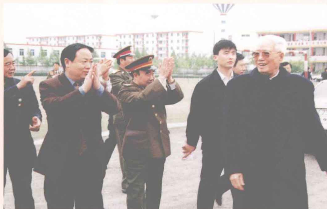
中央军委原副主席张震（右一）到漯河市视察工作