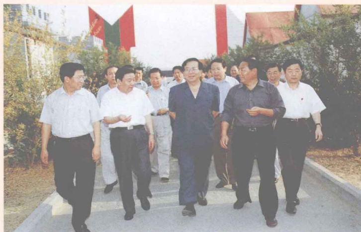
中共中央政治局常委、中央书记处书记、国家副主席曾庆红（前排右三）到漯河市龙堂村高效农业示范园区考察农村工作