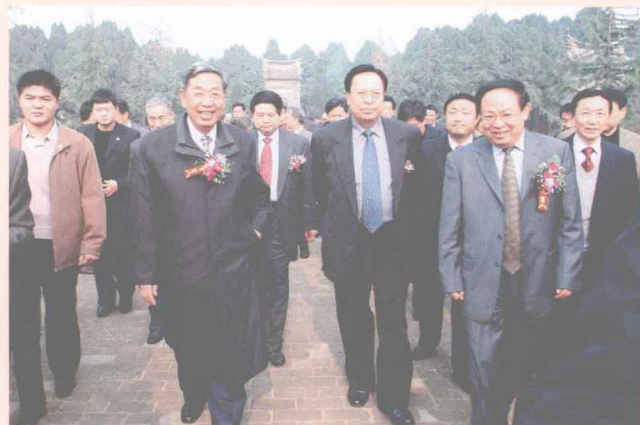
全国人大副委员长许嘉璐(前排左二)、中共河南省委书记徐光春(前排左三)等到许慎陵园进行揭牌