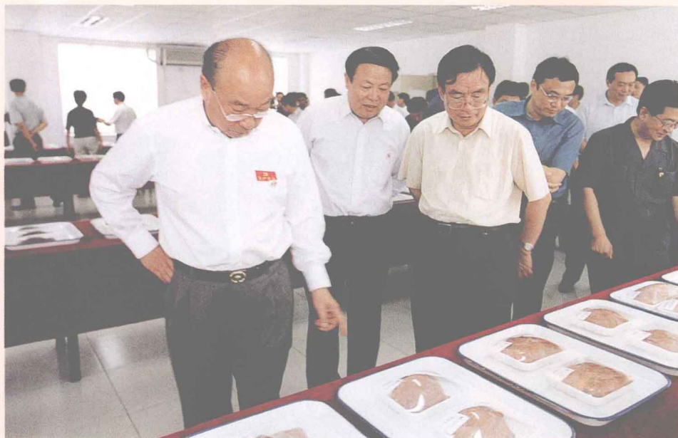
(左三) 中共中央政治局委员、书记处书记、中组部部长贺国强 视察双汇集团