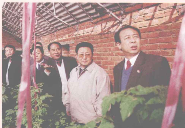
全国政协副主席、中国社会科学院院长陈奎元（右二）到龙云集团无公害蔬菜基地视察