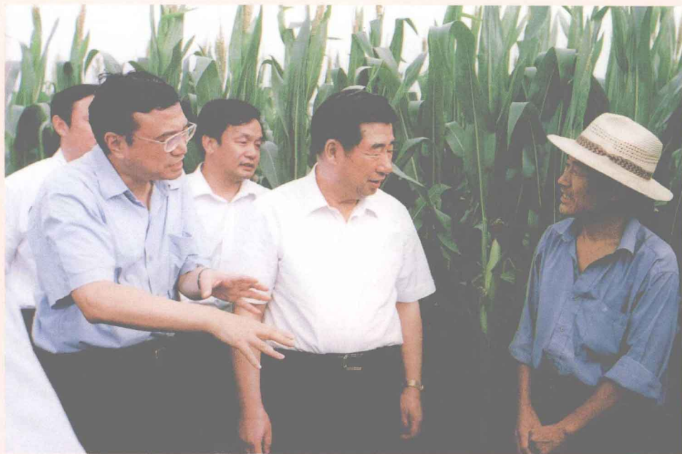
舞阳「七·一七」洪水灾情 中共中央政治局委员、国务院副总理回良玉(右二) 视察