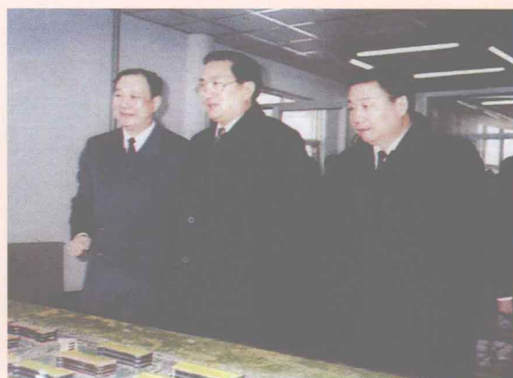
中共中央政治局常委、中央政法委书记罗干（中）视察漯河高新技术开发区