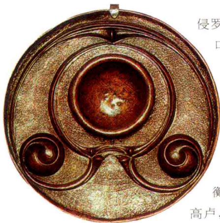
◆ 凯尔特人制造的铜圆盘

公元前58年，恺撒出任高卢总督。作为平民派领袖的恺撒深知如果要与其他两位巨头抗衡，必须获取更大的声望。于是，他将目光投向高卢，希望通过扩展版图来赢取政治资本。恺撒一上任便开始积极备战，高卢人恰好在此时给了他一个绝佳