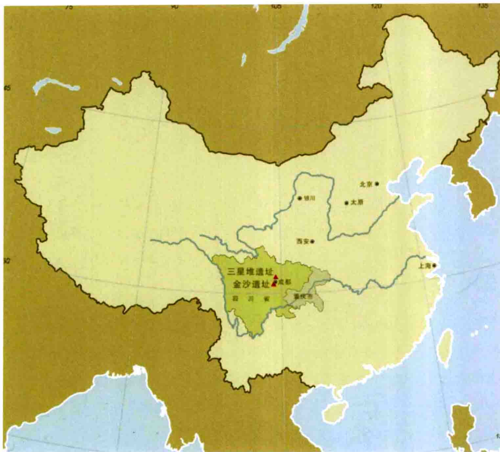
三星堆与金沙遗址位置示意图