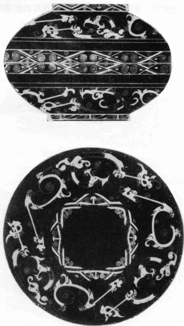
3 战国圆漆盒（测绘图）上：侧面纹饰 下：盖正面纹饰

沿漆器的盖口或器口镶金属箍，名曰“釳器”。它兼有加固和装饰的功能。据现有考古材料来看，釳器也始于战国。成都羊子山172号墓出土的圆漆盒，底、盖上下同大，扣合处各镶铜釳，上面还有精美的错银花纹（插图3）。底、盖的圆足也镶铜圈 ⑫ 。成都在战国时已是制造漆器的重要中心，一些髹漆新工艺首先在这一地区出现是完全可以理解的。