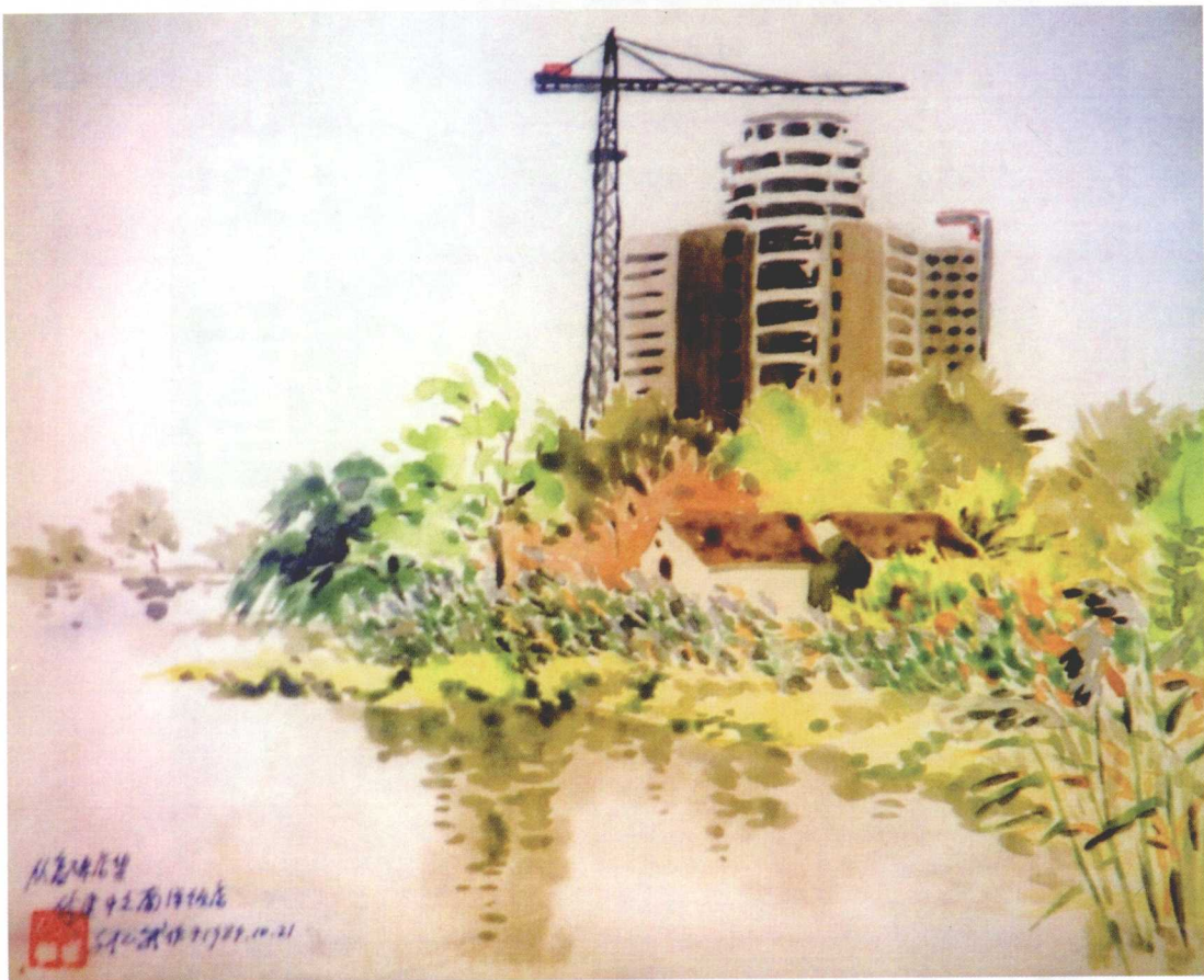
▲ 大老叨 (刘心武的水彩画)