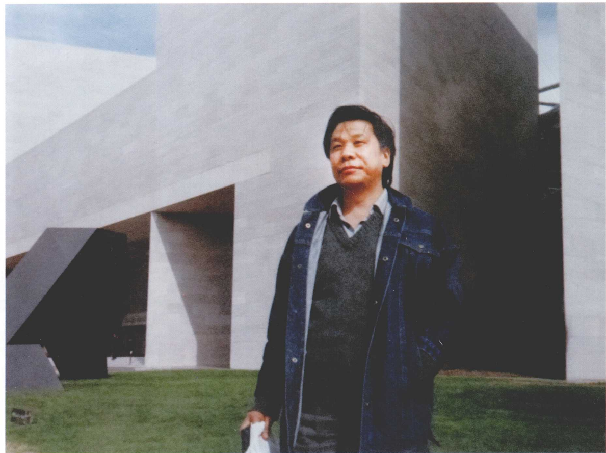
美国·华盛顿东区美术馆 (1987 年) ▼