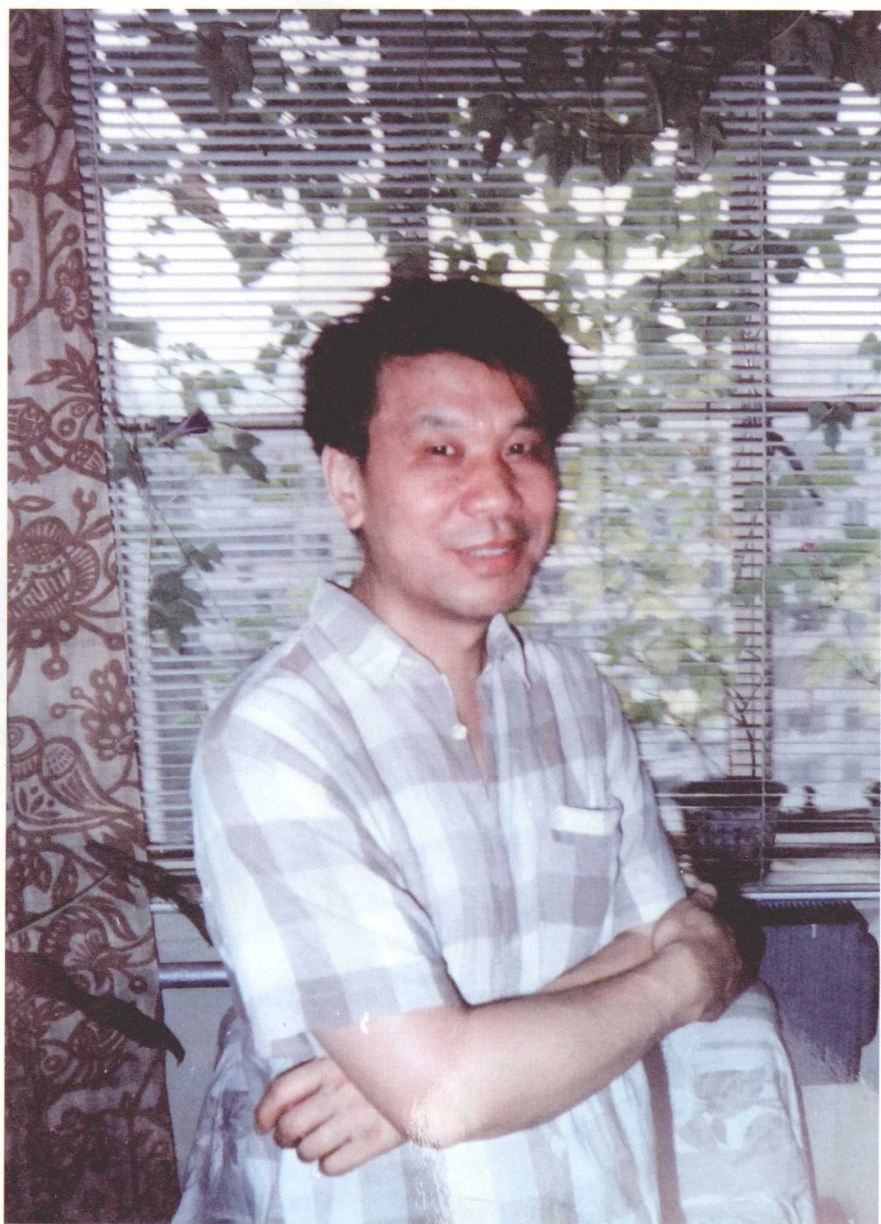
▲ 绿叶居中的刘心武（1995年）