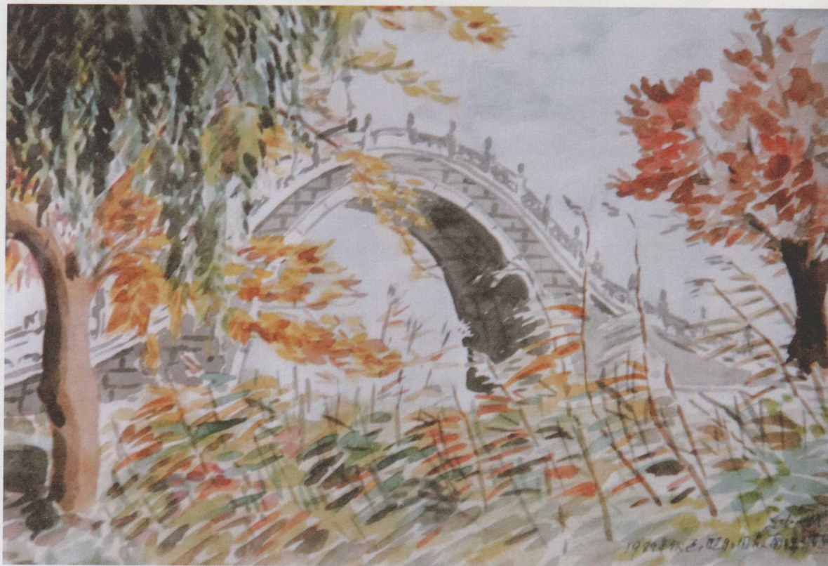
▲ 刘心武画颐和园罗锅桥（水彩）