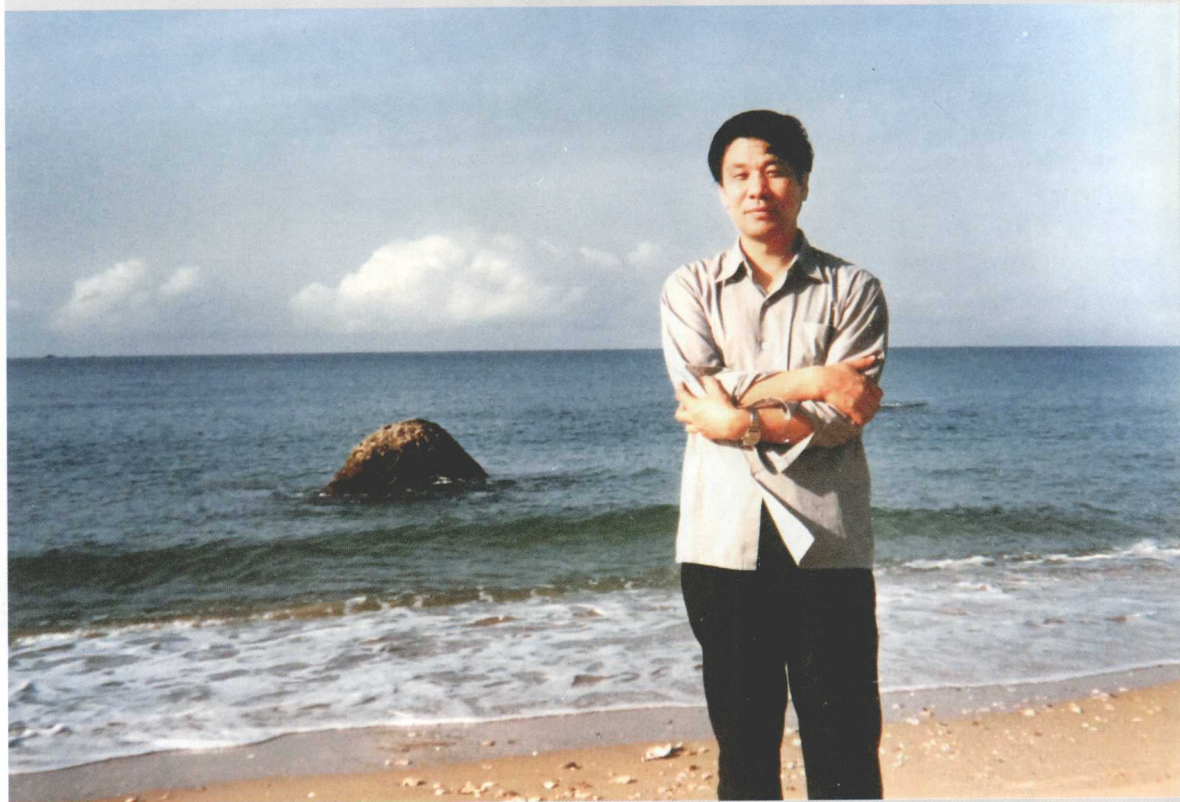
▲ 沐浴海风 (1996年)