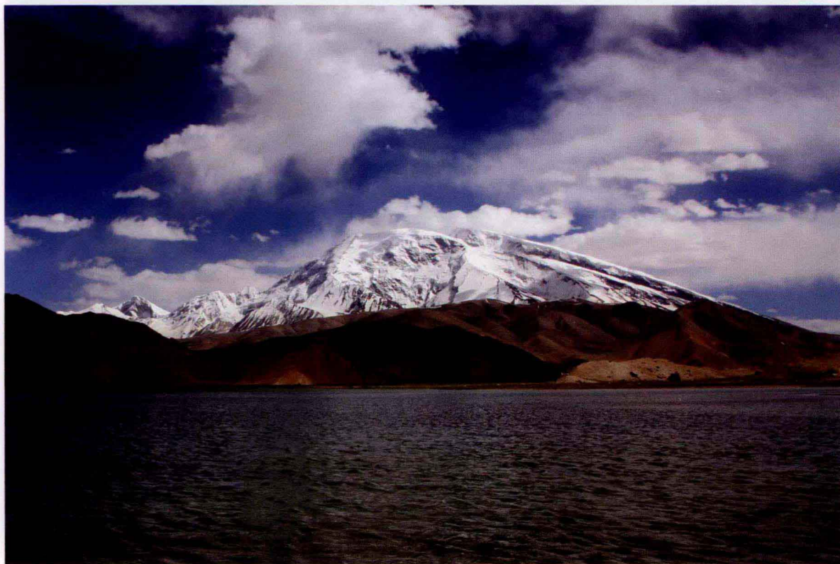
美丽的慕士塔格山和喀拉库勒湖