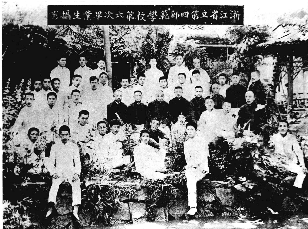
1920年巴人(前排左一)从四师毕业。