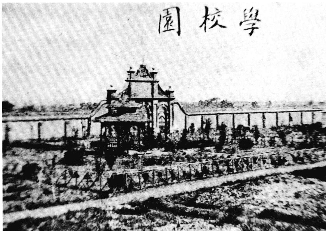
1912年浙江省立第四中学校门。宁波师范学堂创办于光绪三十一年，1913年宁波师范学校改名为浙江省立第四师范学校。后师范并入中学，称浙江省立第四中学，现为浙江省宁波中学。