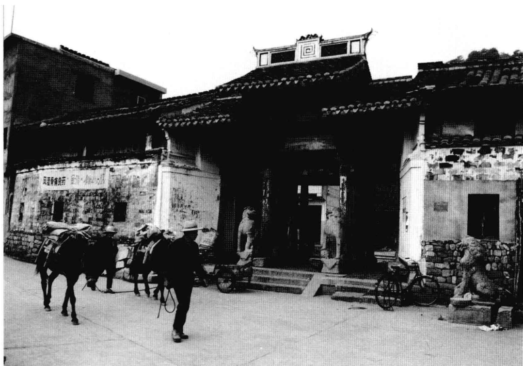
王钊故居狮子门。王钊(?—1566)，明嘉靖年间进士，后任南京工部尚书。