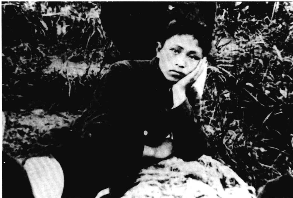
巴人在无锡春游 (1920年)。