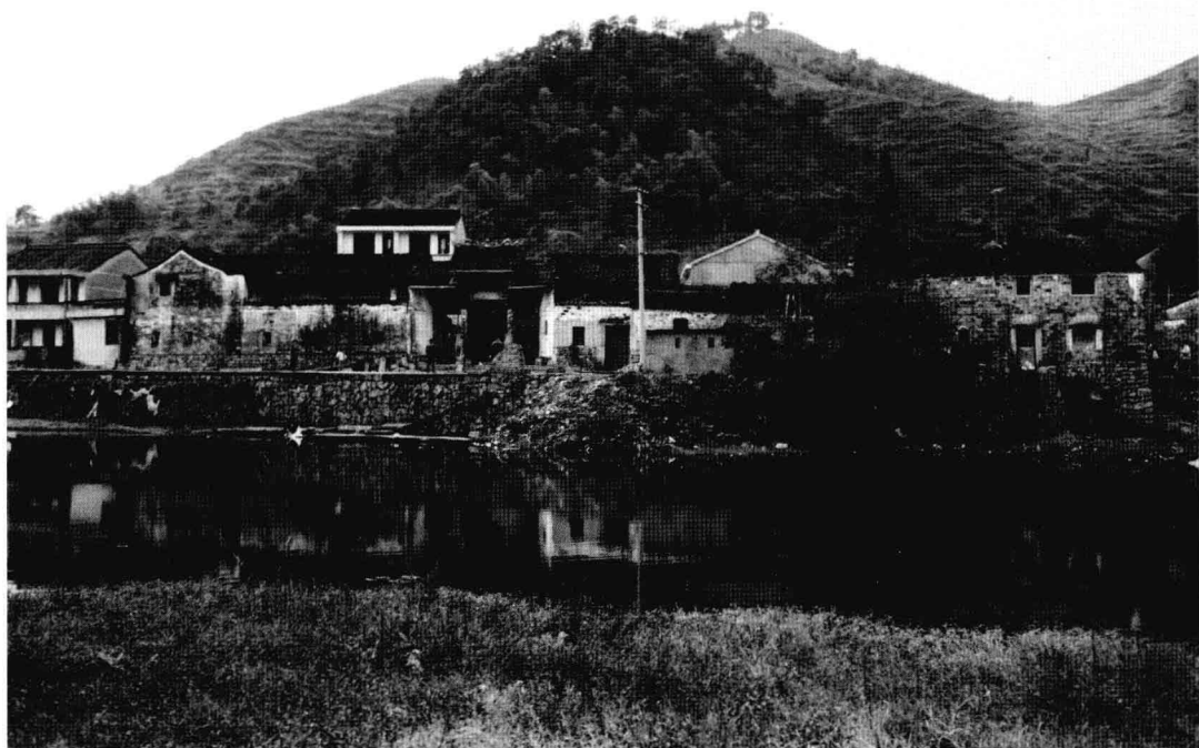
浙江省奉化市大堰村。