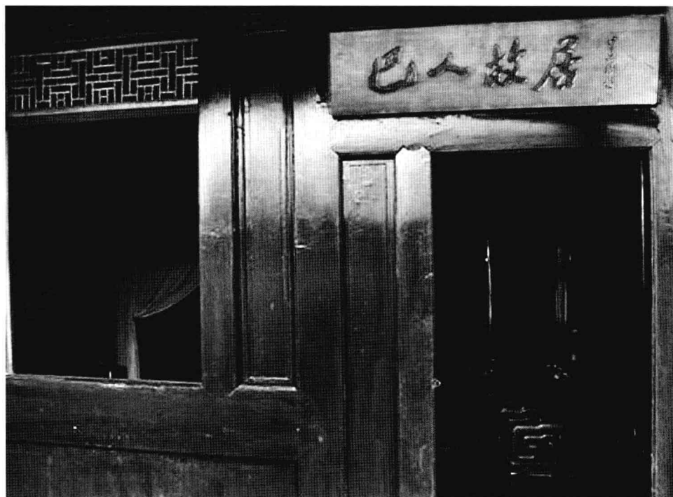
巴人故居的匾额由沙孟海题写。