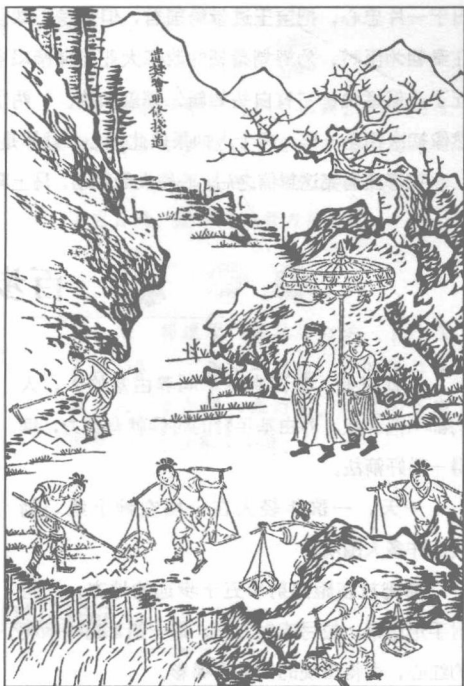
大将军韩信命数百人修复栈道，像是要从此路出兵，进军关中。

章邯慌慌张张地派兵去陈仓截杀汉军。可是，这时韩信已经指挥军队抢占了有利位置，汉军的气势正旺，锐不可当，章邯的军队根本不是他们的对手。韩信趁势挥军东征，关中的百姓都自发接应汉军。汉军节节胜利，先后降服了雍王章邯、塞王司马欣和翟王董翳。刘邦重新占据了咸阳，他在萧何的辅佐下，用心经营关中，为之后的“楚汉之争”做好了充分的准备。