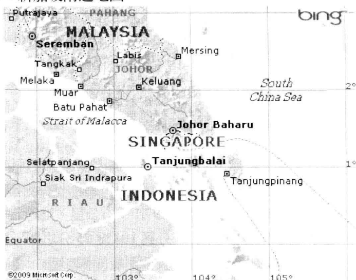
圖 1-1：新加坡附近地圖