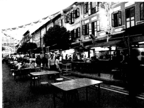
圖 1-3：中國城 Smith Street