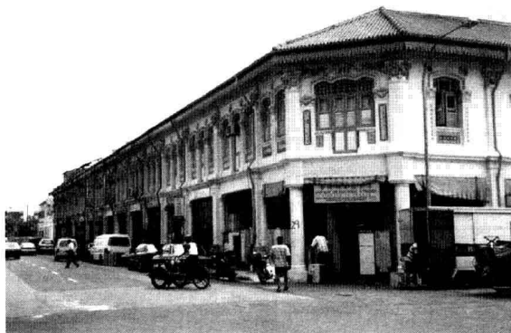
圖 1-4：新加坡的小印度商業區