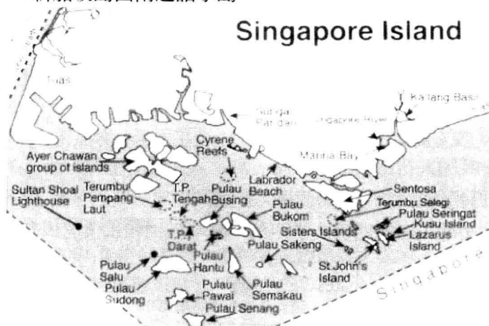
圖 1-2：新加坡島西南邊諸小島