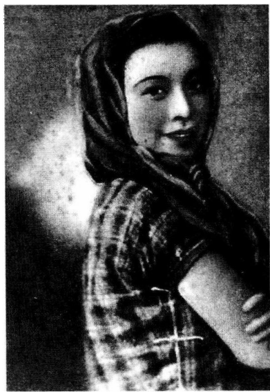
江青为《中华》杂志拍的封面。