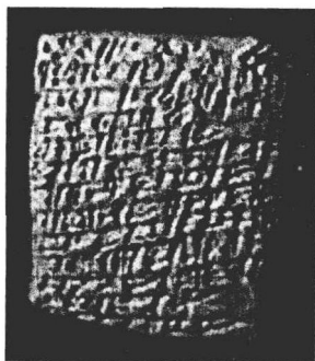
图 1-1 泥板书

进入巴比伦时期后,科学知识有了进一步的发展,巴比伦人在几何、建筑、水利、机械等方面的知识积累更为丰富,尤其是天文学和数学有了较大发展。巴比伦文明在公元前3世纪以后逐渐衰落。