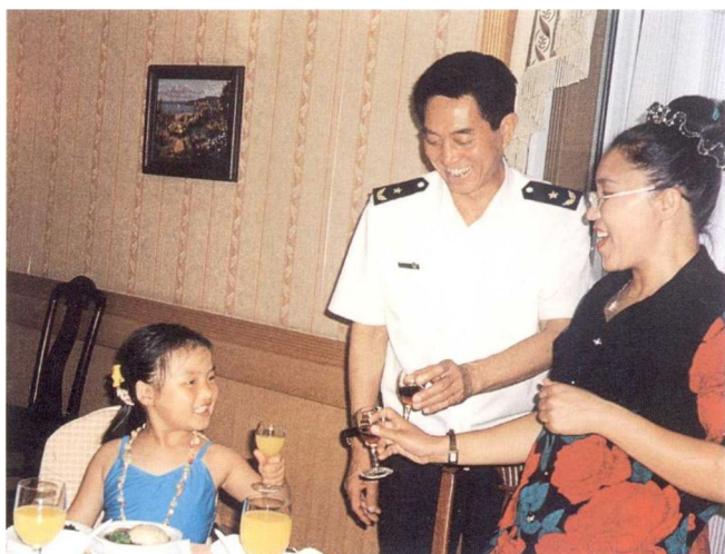
2004年7月和妈妈与中国人民解放军海军副司令员 郑宝华（中将）在大连共进午餐