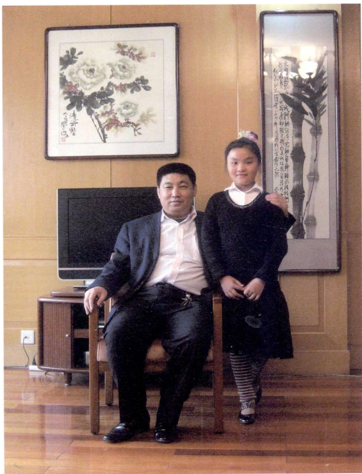
2009年4月8日和河北省作家协会主席关仁山在 关主席办公室