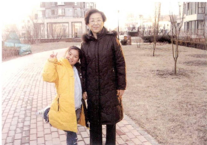
2008年1月与中国人民解放军254医院副校长、 女将军高春瑞于天津