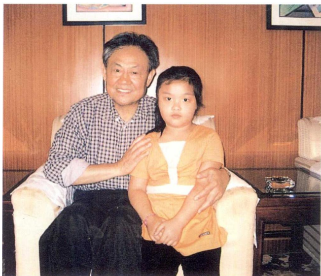
2006年9月与中国人民解放军济南军区副司令员、 空军司令员郭玉祥在丰南政府招待处