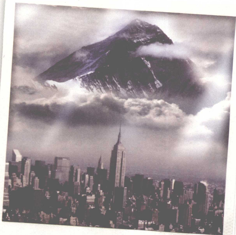
奥林匹斯山（诸神之地）

我今年十二岁。直到几个月前，我还是扬西学院的一名寄宿生。扬西学院是坐落于纽约州北部的一个专为问题儿童所开设的私立学校。那么，我是一个问题儿童吗？没错，你可以这么说。