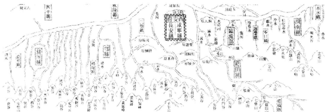
图为（清）《长安府志》中的终南长安地理图局部