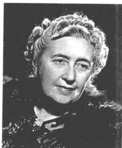
阿加莎·克里斯蒂 Agatha Christie (1890—1976)