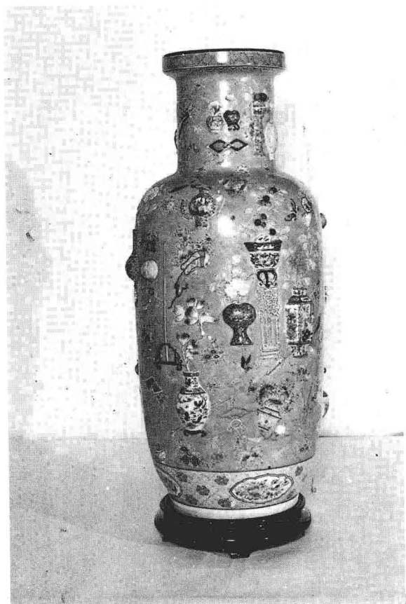
稀世珍品：事件花卉。曾荣获中国工艺美术 优秀作品奖。现为日本恩巴株式会社收藏。