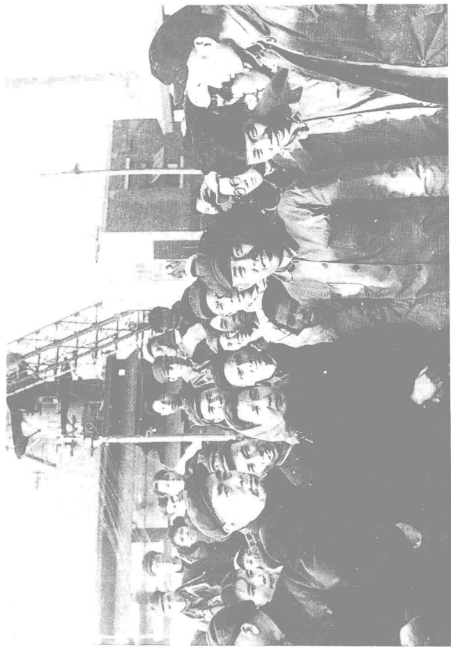
周恩来总理视察广州钢铁厂（一九五九年一月十三日）