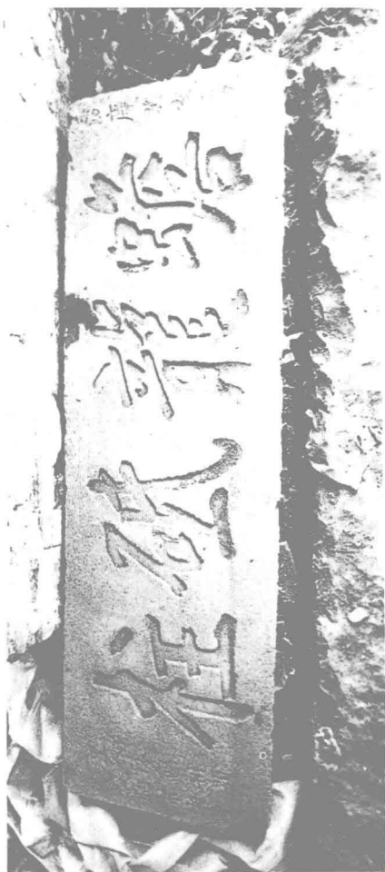
“蟾龙砥柱”石额(清·宋湘书)