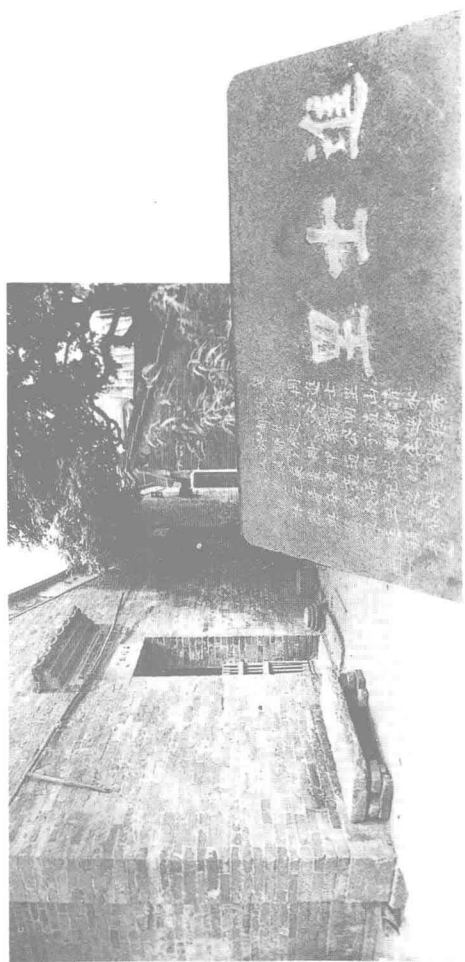
梁佩兰故居及进士里石额