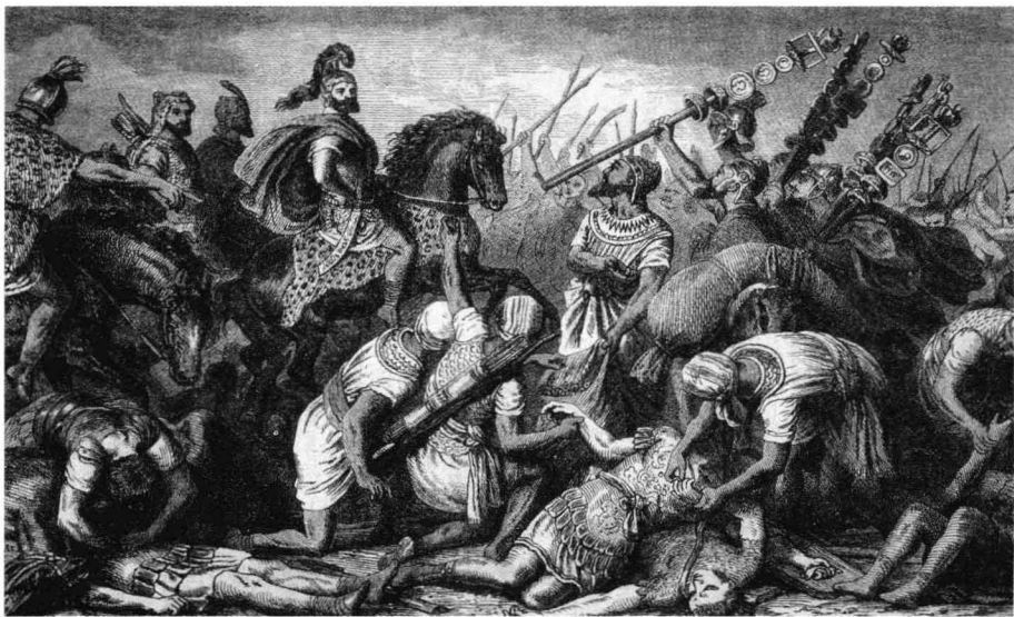
汉尼拔率迦太基军作战