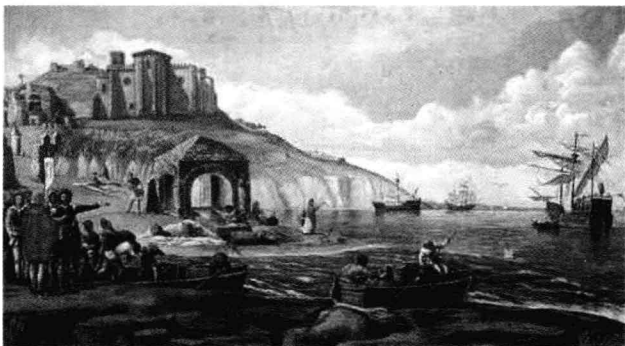
1492年9月2日，哥伦布“发现新大陆之旅”从西班牙戈梅拉岛启航

15、16世纪是整个世界的转折点，当迪亚士找到了新的海岛、达伽马发现了最有利的航道、哥伦布发现了新大陆、麦哲伦找到了东南亚之后，整