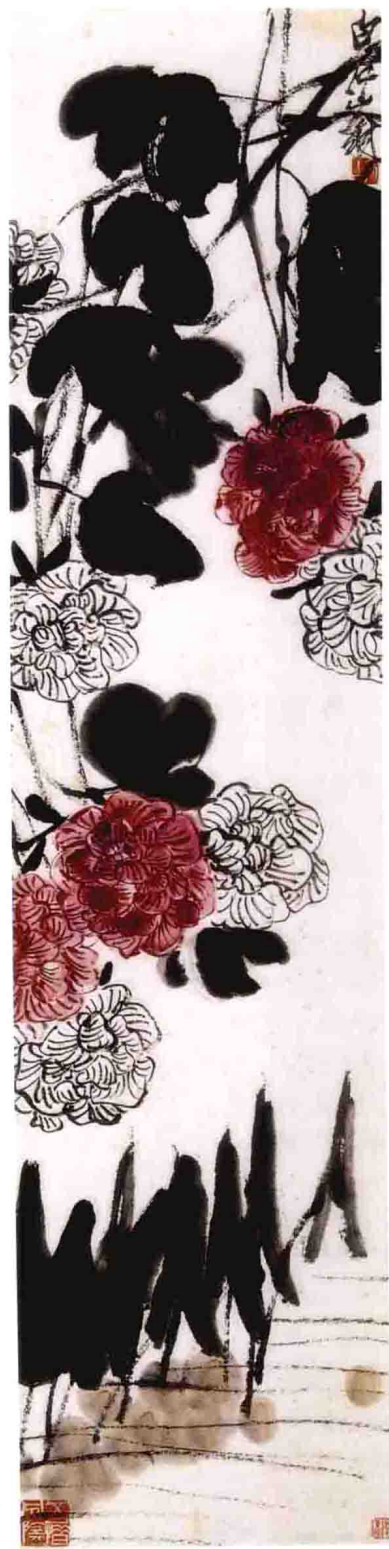
图二 《芙蓉慈姑》（七十岁左右）