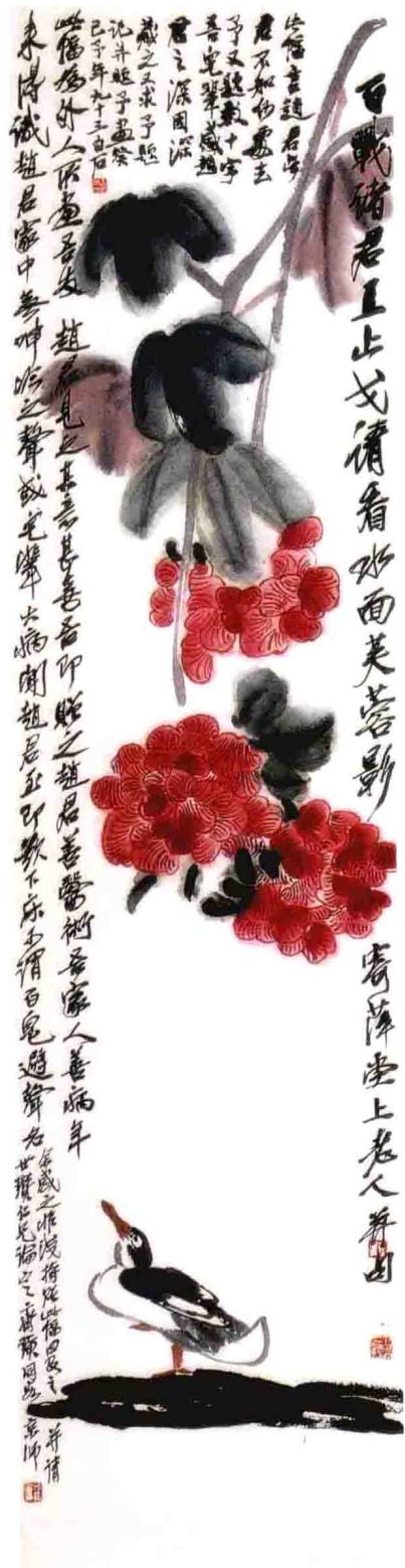
图一 《芙蓉鸭子》（七十岁左右）