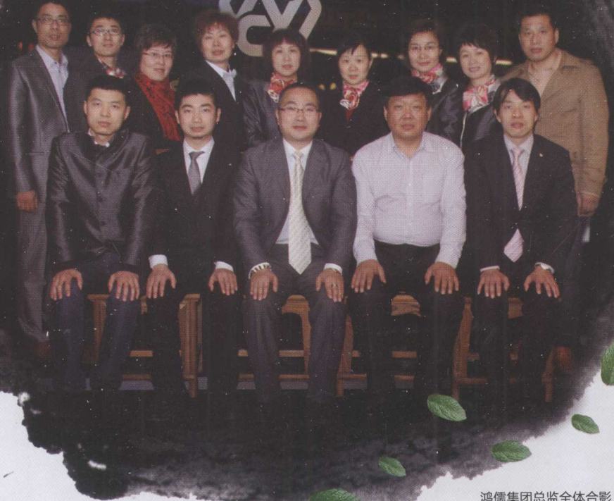
鴻儒集團總監全體合影