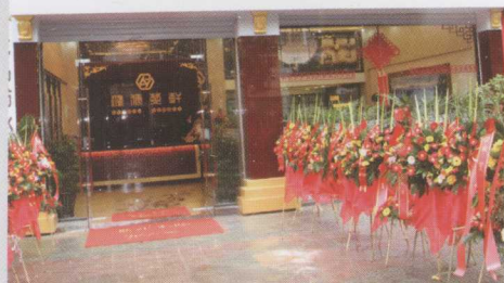
鸿儒茶轩江南总店