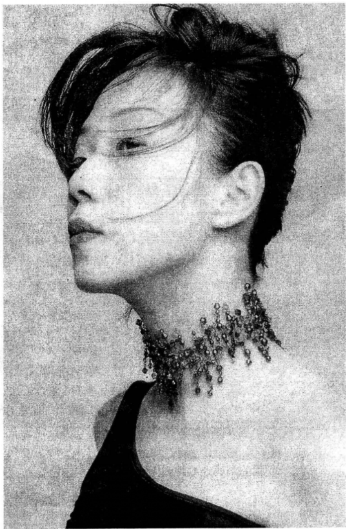
被丈夫抛弃的彩凤悲愤交集