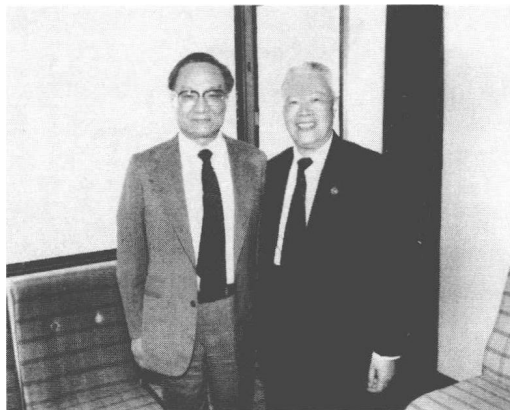
许崇德与金庸先生(左)

《涓水苔痕》一书的编者署名“钟岱”(崇德的谐音),由查良镛(金庸)先生题写书名和作序,并由香港明报出版社出版发行。对许崇德来说,这是半个世纪之后奉献给姐姐许崇道的一瓣心香。而对金庸的侠义相助,许崇德非常感激。