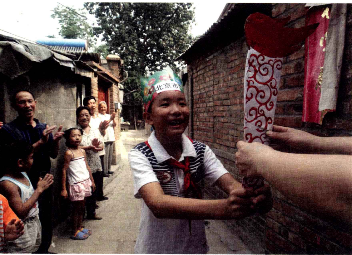
▲ 2007年7月25日上午9时，北京北新桥社区炮局胡同的居民在胡同里提前为奥运传递了火炬。

尽管还是只言片语，但是我读到了其间包含着的对儿子的思念，对生活的热爱。我知道，作为一个体育迷，父亲与我一样期待奥运。我知道，父亲还将在体育赛事期间继续卖他的冰镇啤酒、矿泉水、水果。他还会在寻觅商机的同时，驻足观看体育赛事。然后，在人群散去，人影寥落的时候，给已经下班的我发信息说：“更快——更高——更强。”