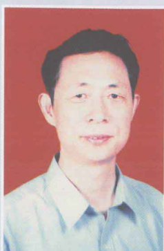
刘家望 湖南省卫生厅厅长