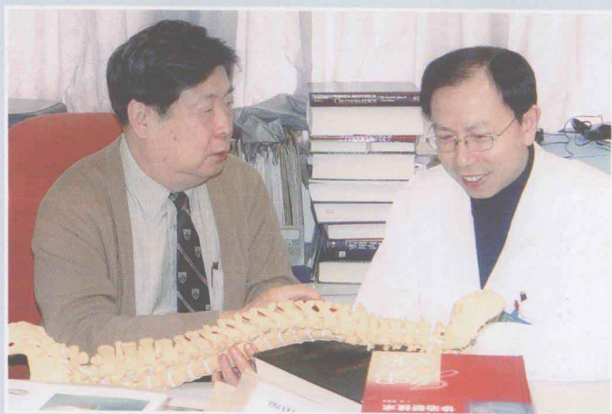
赵定麟将军和陈德玉教授