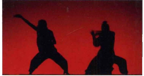
中编 图 7-6 《杀死比尔》剧照(三)