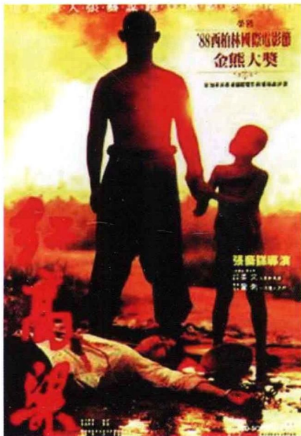
上编 图 4-2 《红高粱》海报