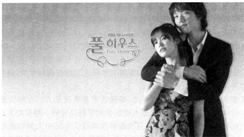
图 1-1 韩剧《浪漫满屋》剧照

影视艺术是人类最年轻的艺术,也是人类现实中最生机勃勃的艺术,是人类生活里最富创造性的艺术。你可以不喜欢演戏,但一定会喜欢看戏。情感的对象化形式是艺术的特征,情感的传达是艺术的功能,人的确证则是艺术的本质。而且,正因为艺术是人的确证,所以它是情感的传达;正因为艺术是情感的传达,所以它是情感的对象化形式。 ① 正如在韩剧《浪漫满屋》(图 1-1)中,我们看到灰姑娘韩智恩战胜了富家女江慧媛一样,现实生活中,一般都是富家女战胜灰姑娘,在电视剧中,灰姑娘战胜了富家女。这样的剧情在既得利益者富家女看后会一笑而过,而观看电视剧的观众十之八九都是灰姑娘,她们在荧幕上暂时找到了自己情感安放的位置。人类的生活在电视剧这样的艺术中得到了一次平衡,灰姑娘、富家女都在同一部作品中找到了情感的传达和自我的确证。