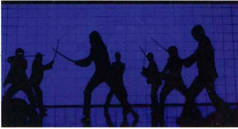
中编 图 7-5 《杀死比尔》剧照(二)