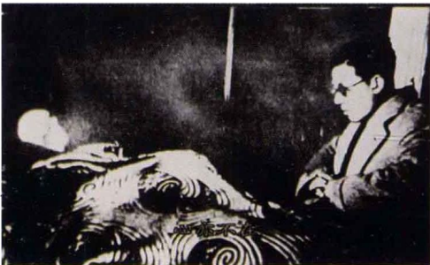
中编 图 9-6 阮玲玉历史照片