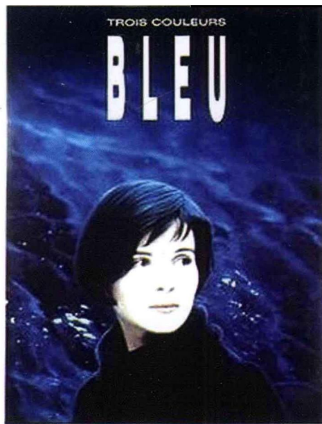
上编 图 4-3 《蓝》海报