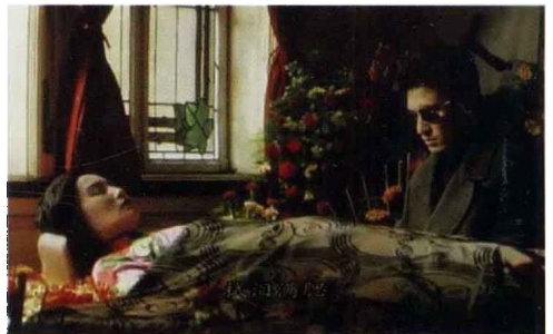
中编 图 9-7 《阮玲玉》剧照(四)