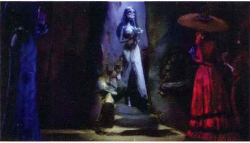
中编 图 8-6 《僵尸新娘》剧照(四)