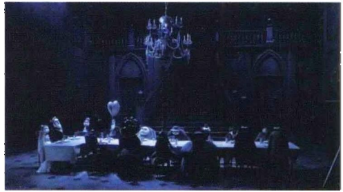
中编 图 8-7 《僵尸新娘》剧照(五)