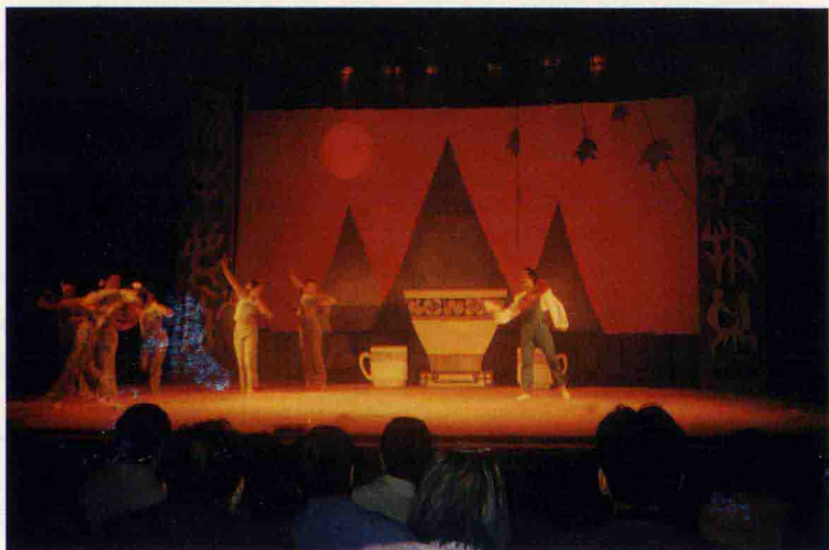
梅山文艺节目《擂茶宴》