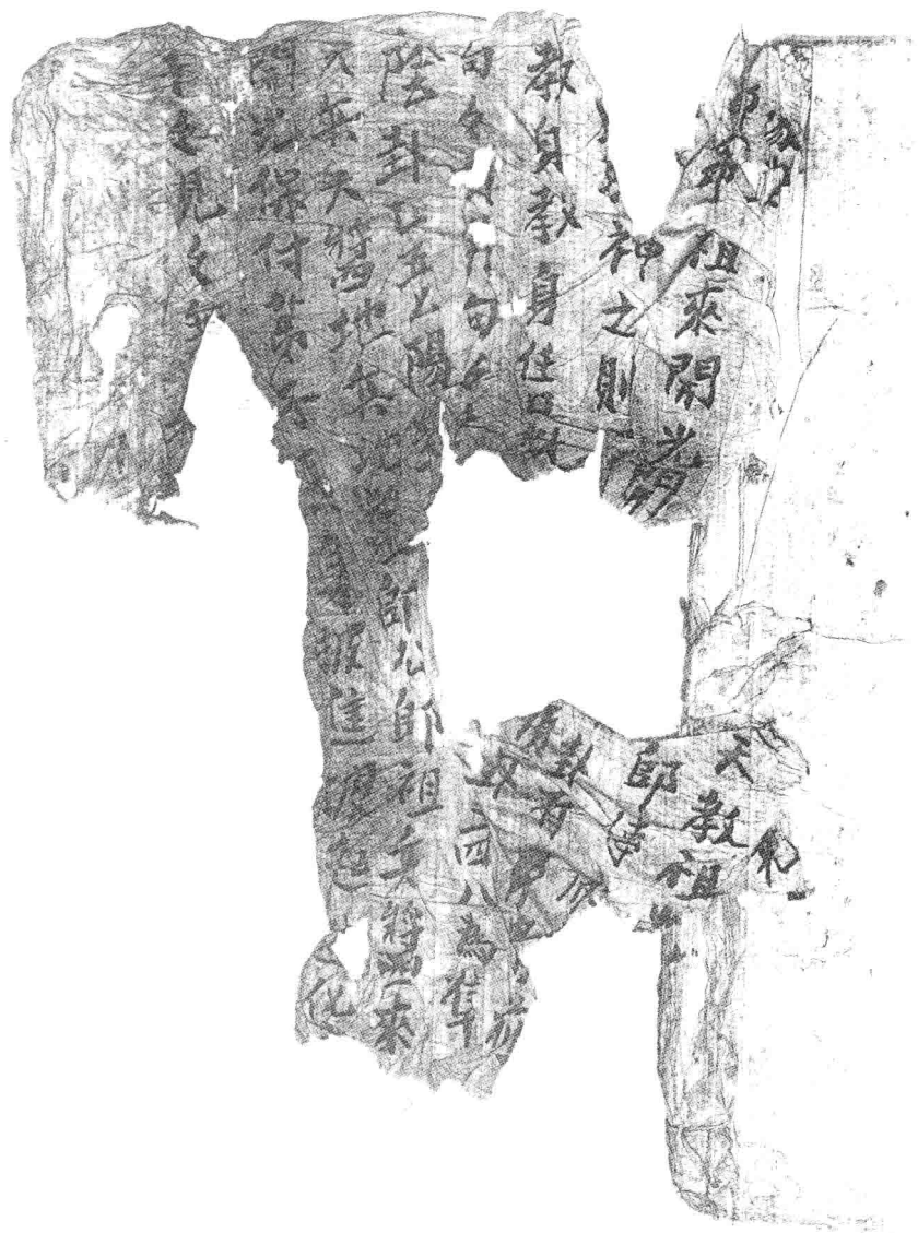
资兴《祷神咒》之一 王标雄保存