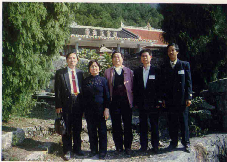
全国第一次梅山文化研讨会湘潭代表 在梅山扶王雕塑像前合影