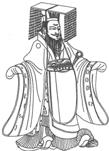
圖2 穿衮冕服的帝王(唐閻立本《歷代帝王圖》)

衮冕用於祭祀先王，其制次於大裘。它和大裘冕的區別是不用羔裘；冕冠前後則各用十二旒，每旒用十二枚珠；公、侯等人所用的冕服亦視其地位逐減；如公用九旒之冕，每旒用珠九顆，以下類推。天子衣裳共用九章，上衣五章：山、龍、華蟲、宗彝、藻；下裳四章：火、粉米、黼、黻。三公以下逐級遞減。所用龍紋也有講究。如《詩經·豳風·九罭》記：“我覲之子，衮衣繡裳。”鄭玄注謂：“六冕之第二者也，畫為九章，天子畫升龍於衣上，公但畫降龍。”後世禮書中常有“衮衣”、“衮龍衣”、“衮龍服”、“龍衮”、“龍卷”、“衮章”、“衮華”等名稱，都指這種畫有升龍紋樣的天子冕服(圖2)。