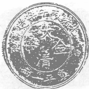
光緒 32 年 光边