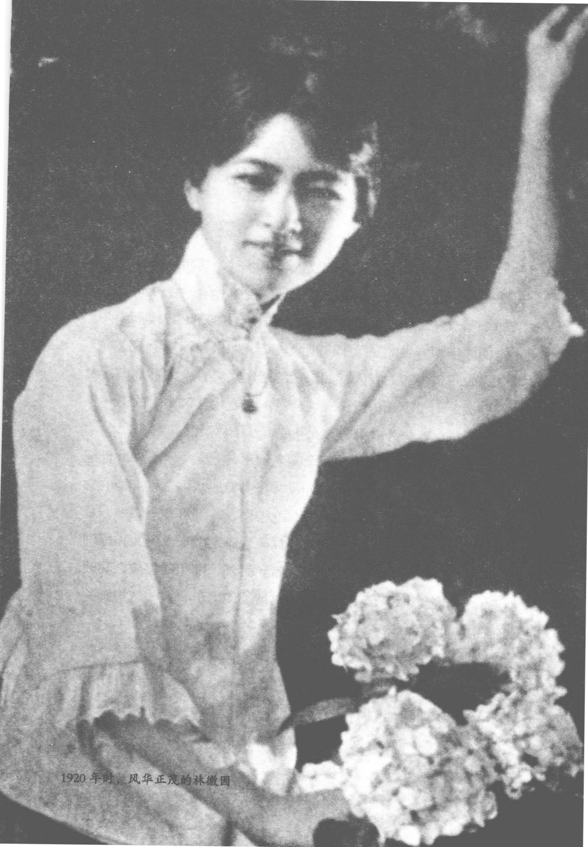
1920年时，风华正茂的林徽因