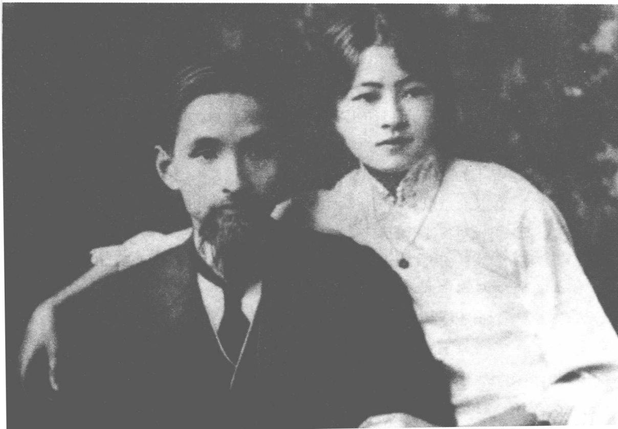
林徽因与父亲林长民

少女时代的林徽因因受书香门第的熏陶，传承了中国传统文化的精粹。父亲林长民思想开明，把自己的掌上明珠送进教会学校读书，使她接触西方文化，学会了一口相当流利的英语。她 16 岁花一般妙龄的时候，随侍父亲旅居英国，游历欧州，