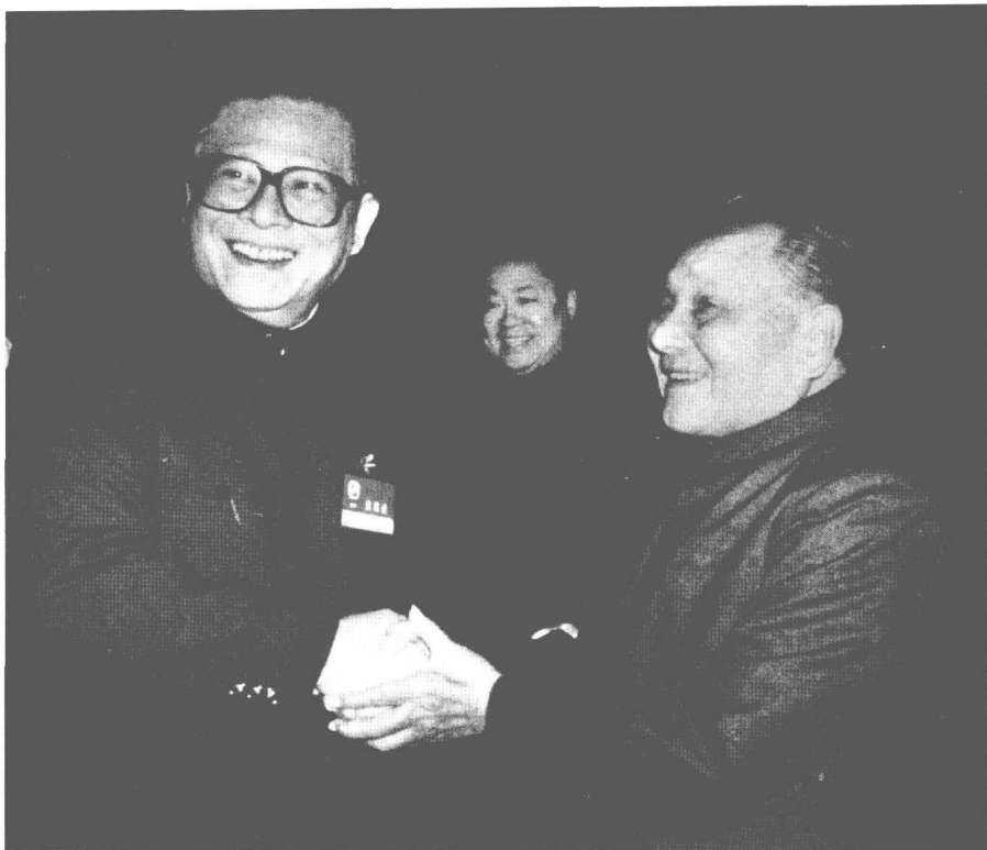
1989年11月9日，邓小平和江泽民亲切握手。