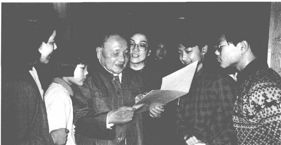
中央正式批准邓小平退休日，四个孙子特意给爷爷制作了贺卡，上面写着：“愿爷爷永远和我们一样年轻！”这是邓小平和孙辈们在看贺卡。