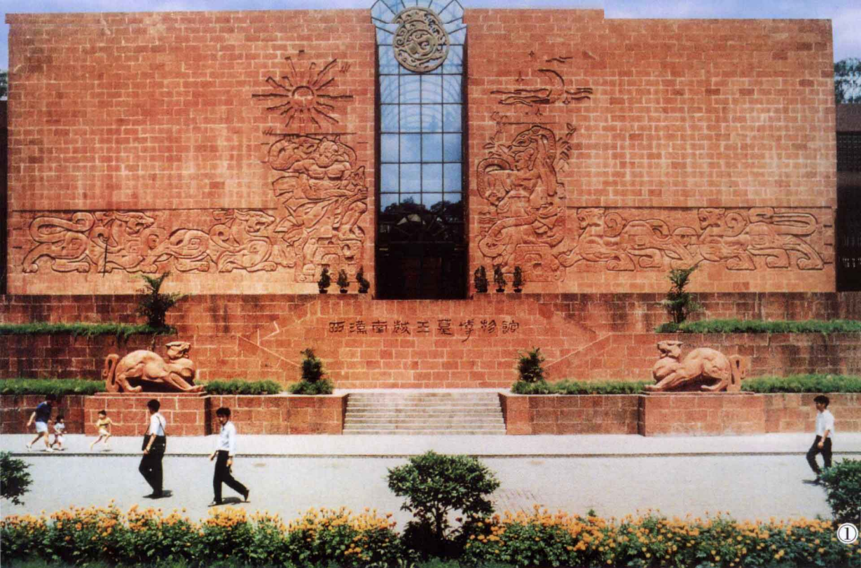
图一 西汉南越王墓博物馆 1.综合楼(上) 2.主楼(下)