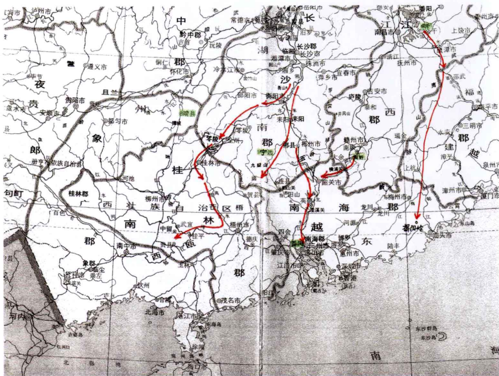
图二 秦统一岭南进军示意图

进行顽强的抵抗，不断夜袭秦军，迫使秦军“三年不解甲弛弩”，大批将士伏尸流血，连领军的主帅屠睢也被越人杀了，战事转入僵持状态。这时“秦乃使尉佗将卒以戍越。”战争转入第二阶段。由“一军处番禺之都”的任嚣和赵佗为主帅，任、赵吸取屠睢冒进的失败教训，实行稳打稳扎、步步为营的战略战术，因应岭南“陆事寡而水事众”的水网地带和沿海岸的运输需要。在番禺（今广州）大规模修建造船基地，赶造船只。前后又过3年，终于取得统一岭南战争的胜利。