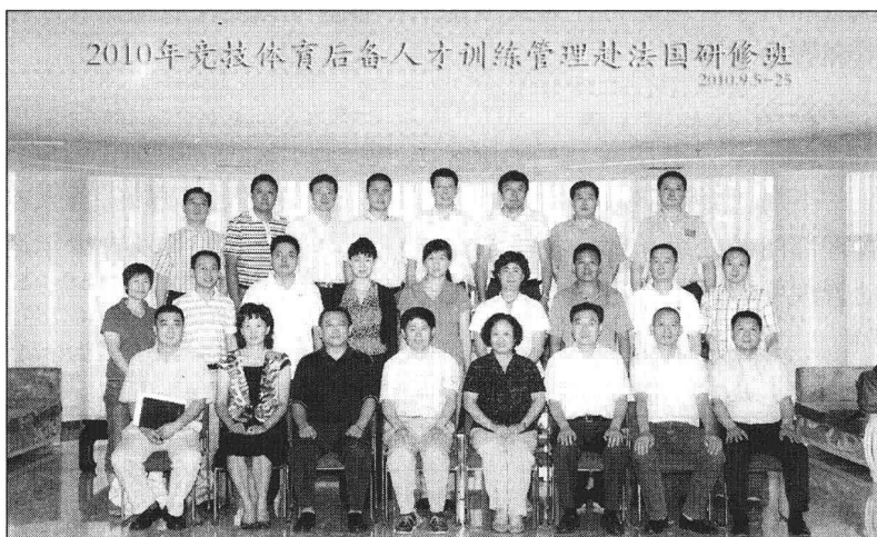
研修班全体学员合影

为加强我国体育后备人才培养，借鉴发达国家的先进经验，努力推进体育强国建设，国家体育总局于2010年9月2日至25日举办了竞技体育后备人才训练管理专项赴法国研修班。本期研