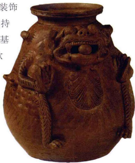
晋异兽尊 宜兴周墓墩出土

以“宜兴窑”为代表的青瓷产品和以“欧窑”为代表的颜色釉高温陶产品在长江中下游地区有一定的传播面,为中国青瓷工艺和新釉陶工艺做出过积极贡献。