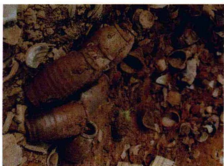
宜兴古窑遗址堆积物