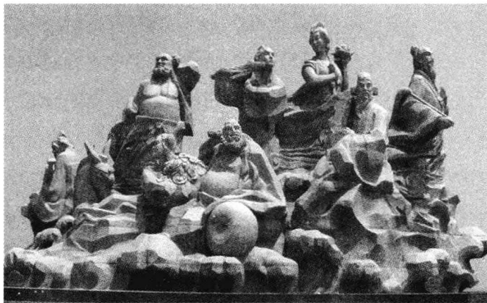
山东烟台蓬莱“八仙渡海口”内的“八仙”雕塑形象

八仙说的是我国古代传说中的八位仙人。在古代的笔记小说和杂剧中，经常可以看到关于八仙的故事，而且八仙的人物版本各不相同。这种情况一直持续到明朝，当时有个叫吴元泰的人写了一篇故事《东游记》，这才让八仙广泛流传，并且成为今天八仙的固定版本，即铁拐李、汉钟离、张果老、蓝采和、何仙姑、吕洞宾、韩湘子、曹国舅。