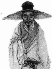
沈心海所绘钱谦益、 柳如是夫妇肖像