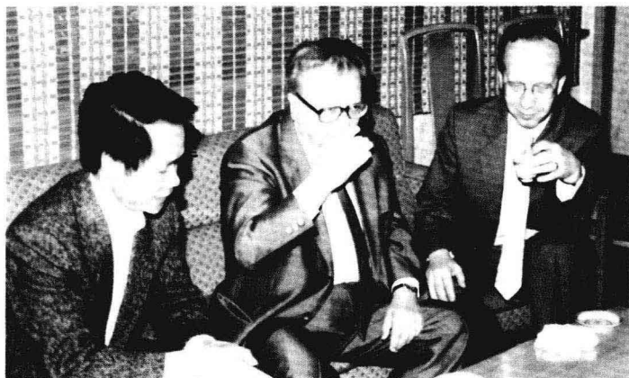
◎ 1988年4月8日，德国统一社会党中央政治局委员、中央书记赫尔曼·阿克森率团访问东莞。图为他和市领导并切座谈。