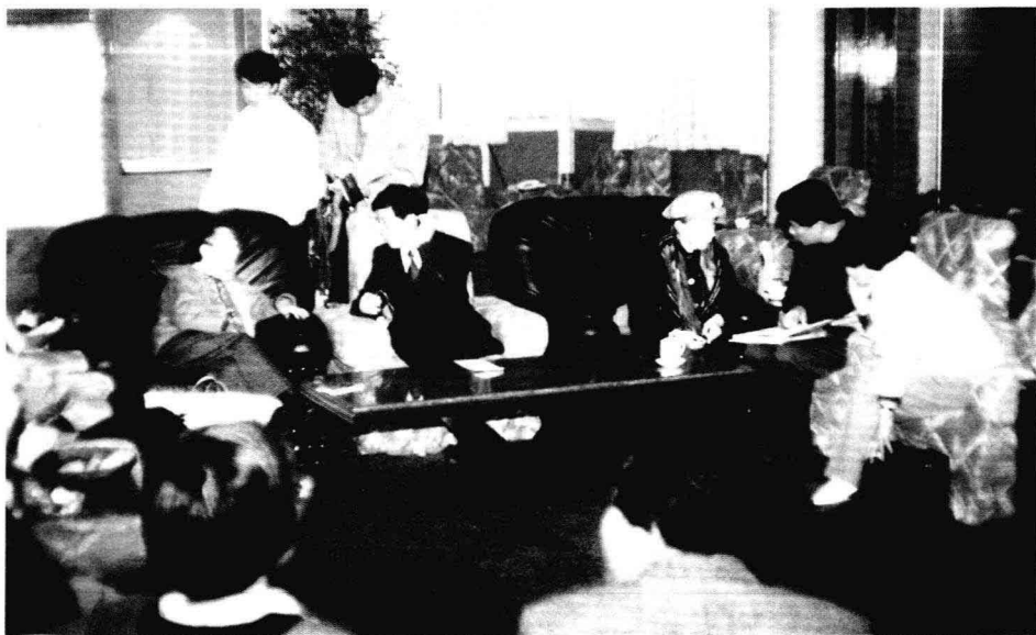
◎ 张闻天的夫人刘英,任弼时的夫人陈琼英,这两位年逾八旬的红军老战士莅莞考察时,受到市领导的热烈欢迎。