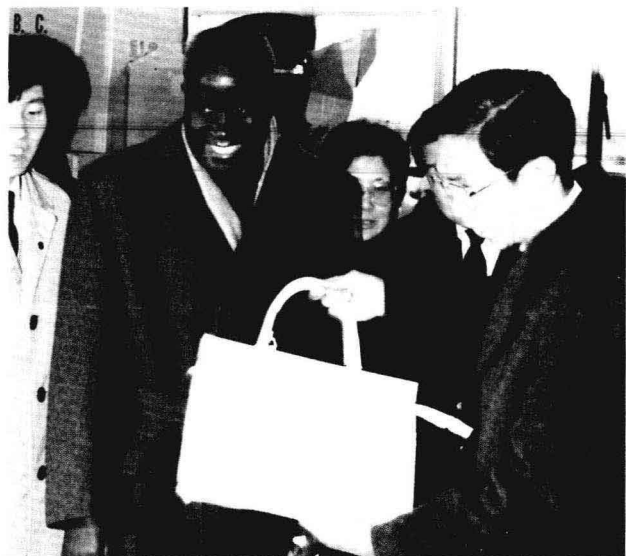
◎ 1998年3月3日，赞比亚总统卡翁达莅莞访问。图为他在茶山镇工厂参观的情形。