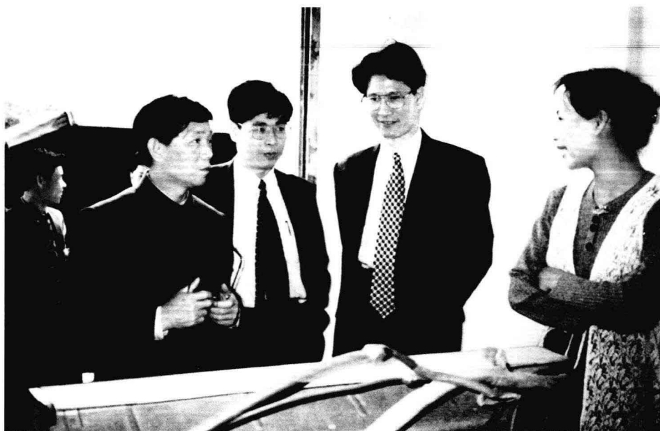
◎ 原省人大常委会副主任在视察石排旧货市场时的情形。