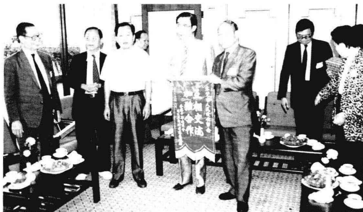
◎ 1988年7月19日，香港中华总商会会长霍英东率团考察珠三角。图为他在东莞与市领导会面时的情形。