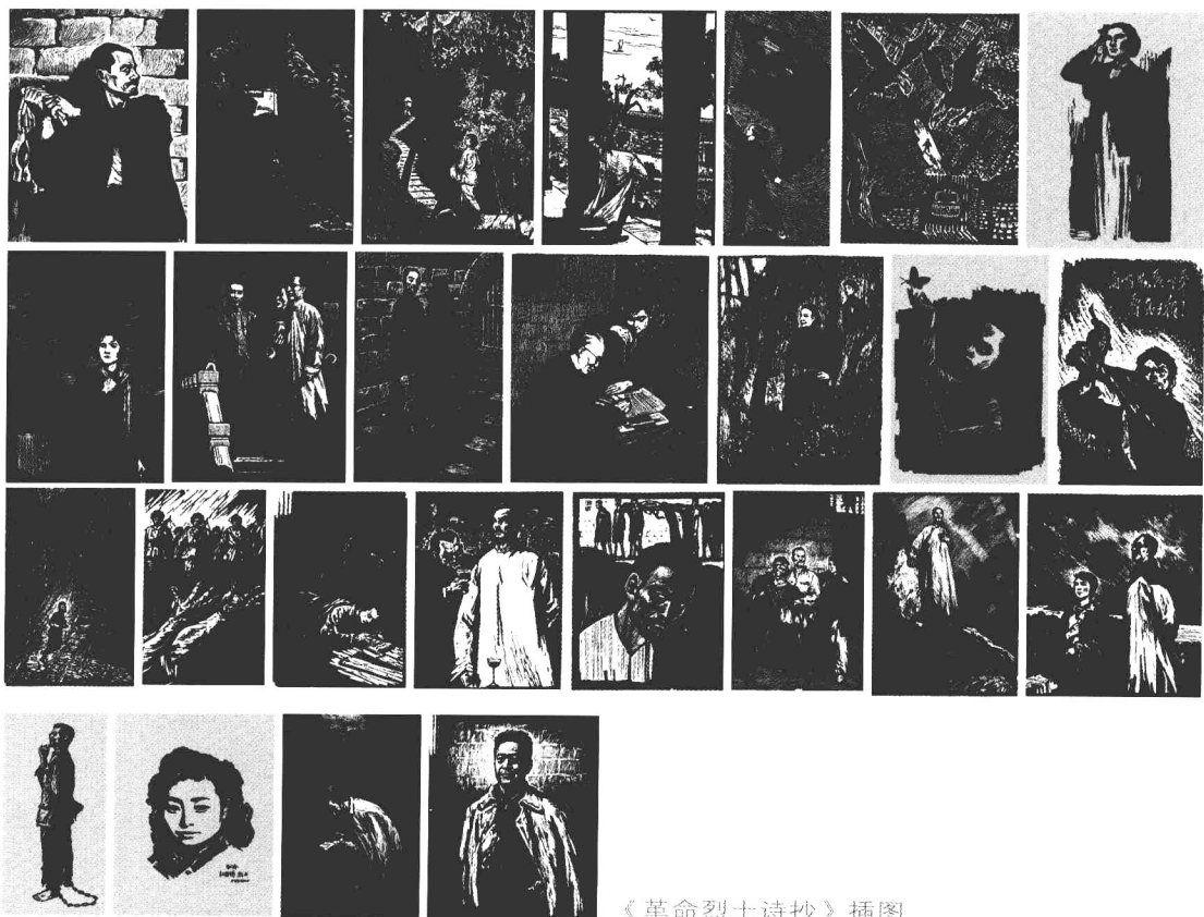
《革命烈士诗抄》插图