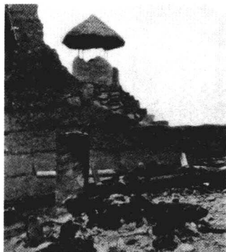
渣滓洞革命志士越狱脱险时推倒的围墙