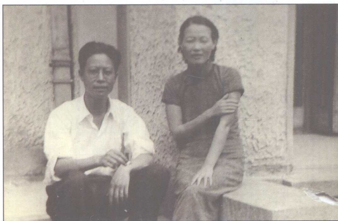
一九四〇年与夫人于愚园路寓前