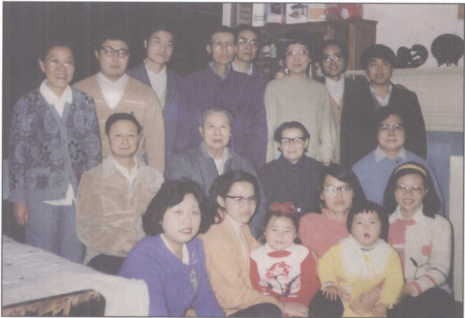
九十华诞四世同堂