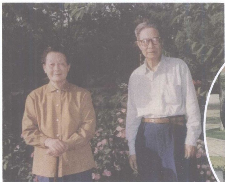
一九八二年与夫人于上海中山公园