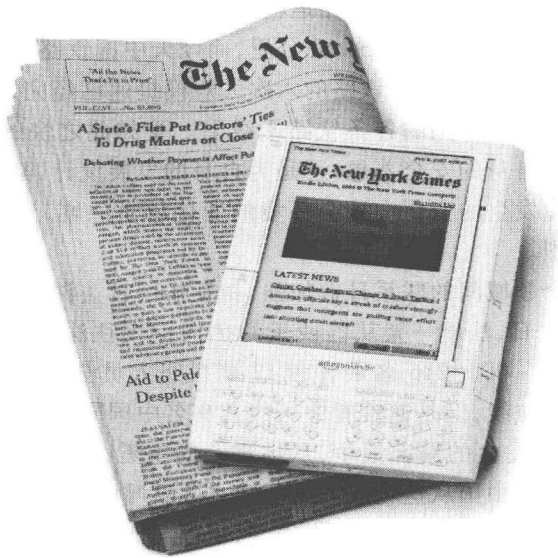
图6 Kindle阅读器与《纽约时报》

尽管由于种种原因,《密苏里人报》的电子版停办了,但是我们可以看到,电子报纸这一形式今天已经成为世界各国的报纸应对新技术挑战的一种普遍方式。与此同时,Amazon的Kindle(见图6)、北大方正的“文房”等电子阅读器,也在为这种电子报纸提供着新的阅读平台。