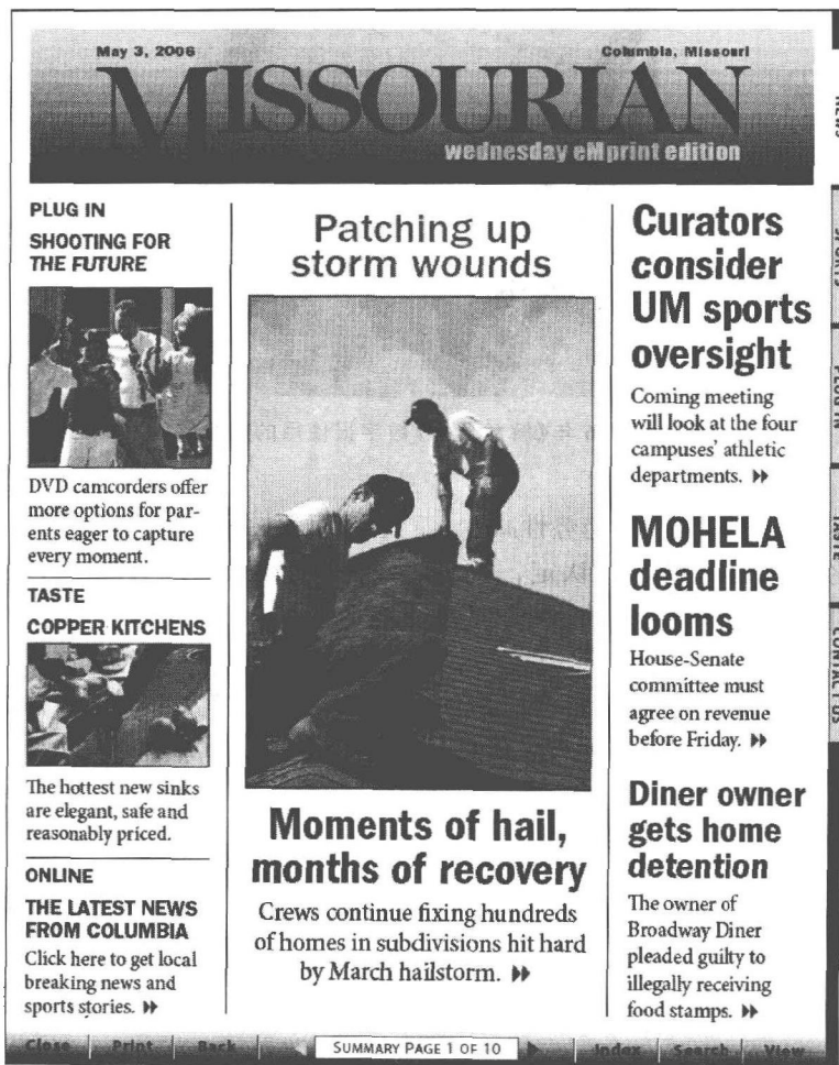
图4 《密苏里人报》电子版截图

进行商业发行的报纸,是一个传统的印刷媒体。密苏里新闻学院就是通过这样一份真正进行商业发行的地区报纸训练学生的新闻工作技能,此举在国际新闻教育机构独树一帜。