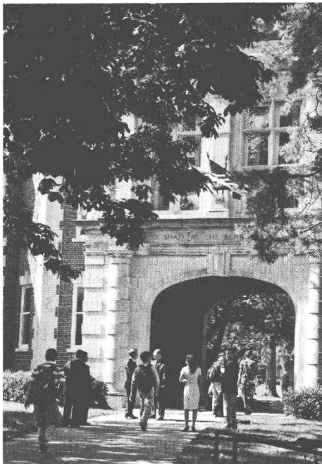
图1 密苏里新闻学院的石头拱门上写着:“智慧是光明的使者。”

美国密苏里新闻学院(见图1)坐落在圣路易斯市以东300多公里宁静的山间。从Google Earth提供的卫星地面图像可以看到,它位于北纬38°,西经92°,那里丘陵起伏,林木掩映。