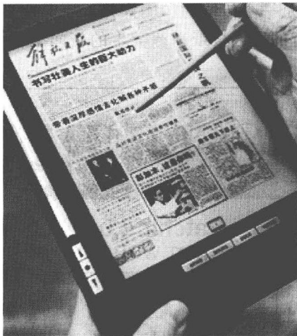
图5 2006年《解放日报》数字报使用的接收终端