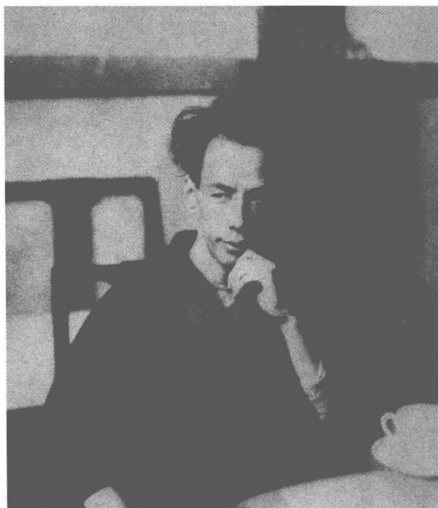
芥川最后一次在新潟高校演讲