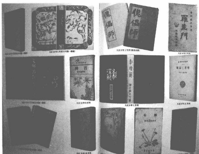
在日本出版的芥川作品单行本