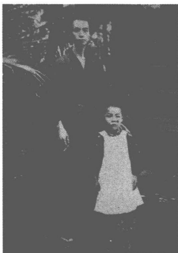
和长男比吕志于田端