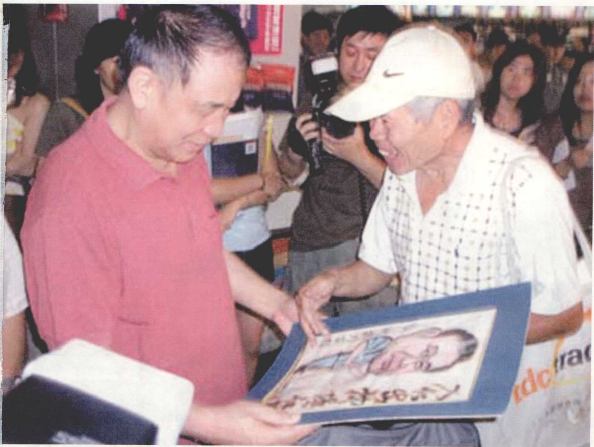
▲ 签售《刘心武揭秘〈红楼梦〉》时接受读者赠送画像（2005年）