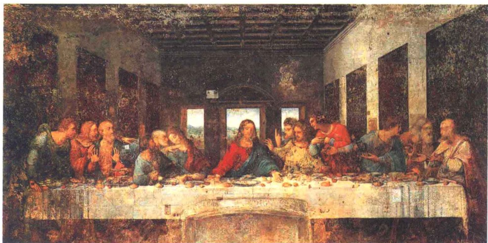
达·芬奇◎最后的晚餐 1498