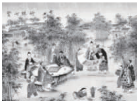
竹林七贤弈棋赏画休闲图

1970年，国际娱憩协会(International Recreation Association)颁布的《休闲宪章》指出：“休闲就是人们在完成工作和其他任务之后，在自由支配的闲暇时间内所进行的以补偿性活动为基础的活动”。这一界定较好地阐明了“休闲”在“时间”和“行为”两个维度的内涵，可以看作是相对较为权威的定义。首先，休闲活动所利用的是人们可以自由支配的闲暇时间；其次，休闲活动是区别于工作的一种在放松状态下进行的学习交流或娱乐游憩行为。实际上，休闲活动还具有明确的目的性，即生命保健、体能恢复、身心愉悦等。科学文明的休闲方式可以有效地促进能量的储蓄和释放，它包括对智能、体能的调节和生理、心理机能的锻炼。