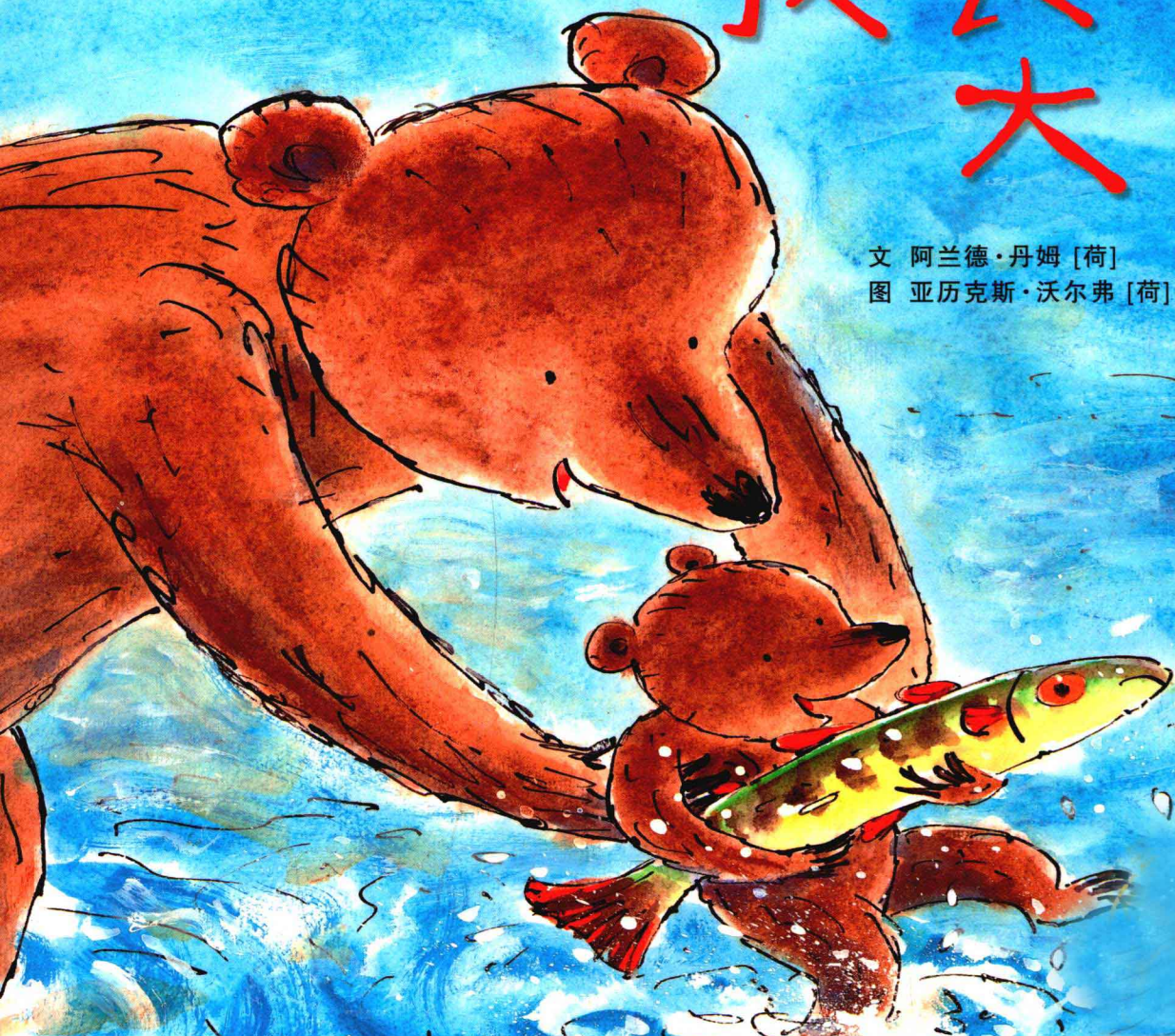
图 亚历克斯·沃尔弗 [荷]