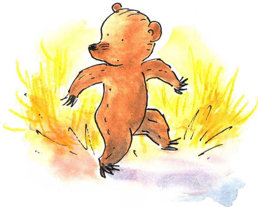
图 亚历克斯·沃尔弗 [荷]