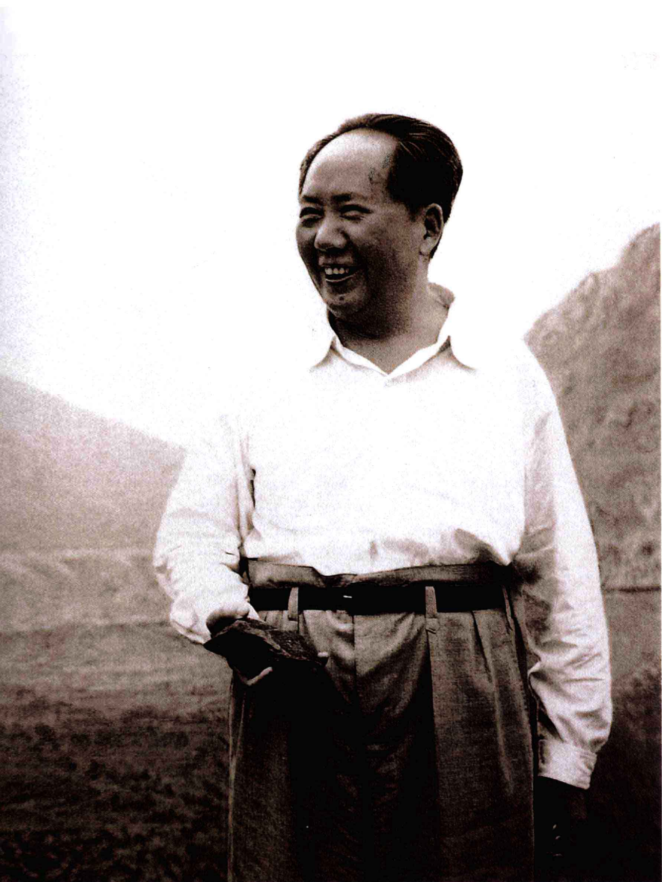
1958年9月15日毛泽东主席视察大冶铁矿