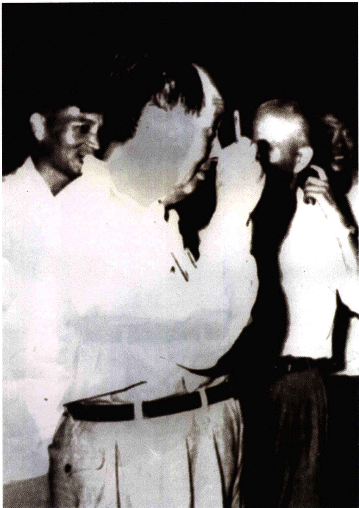
1958年9月15日毛泽东主席视察大冶钢厂