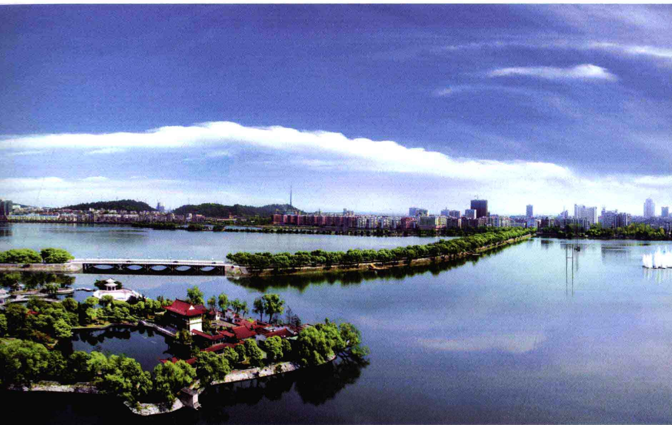
中国矿冶历史文化名城、山水园林城市—黄石