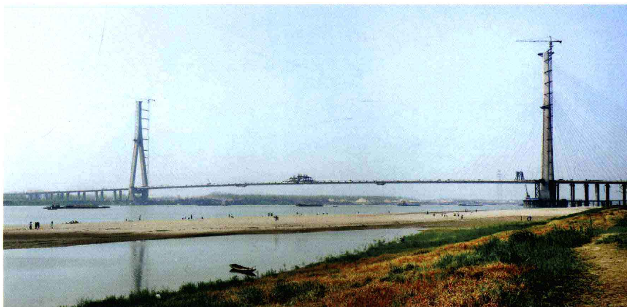
黄石鄂东长江公路大桥