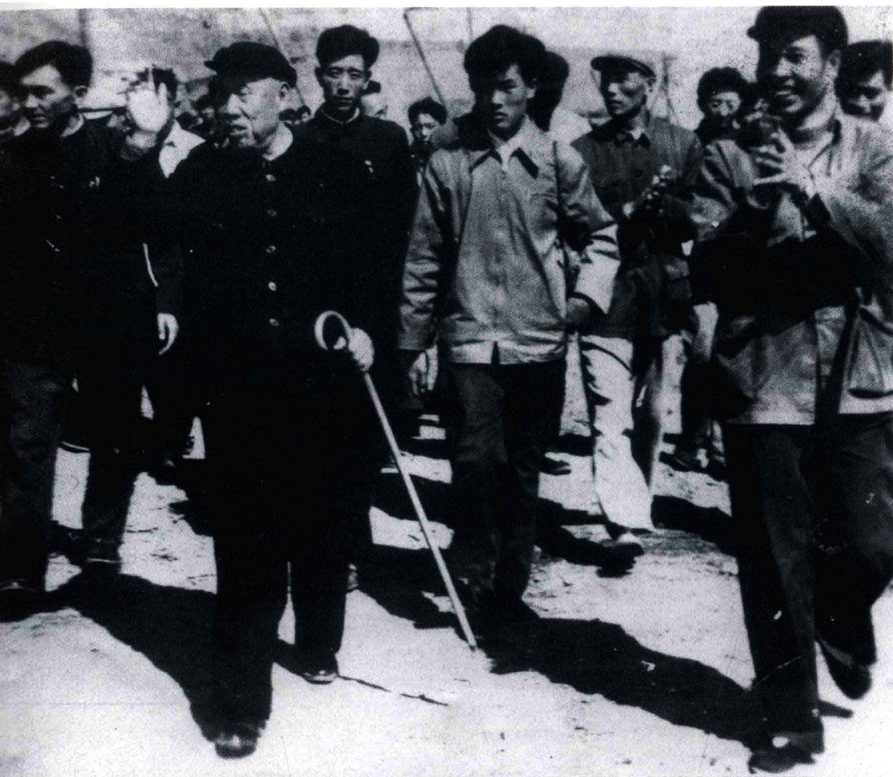
1960年10月19日董必武副主席视察大冶铁矿