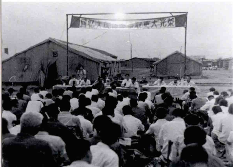
当年采油二矿（现采油二厂）回忆大庆传统、 争取更大光荣形势教育会会场