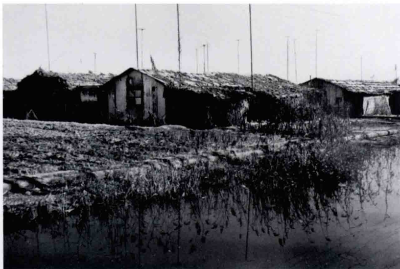
当年采油二矿（现采油二厂）作业大队职工宿舍