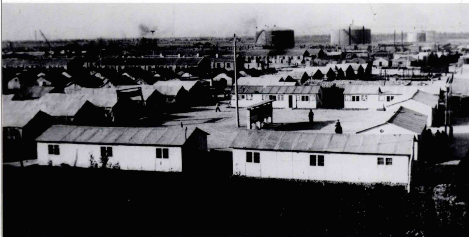
当年的采油二矿（现采油二厂）机关办公区