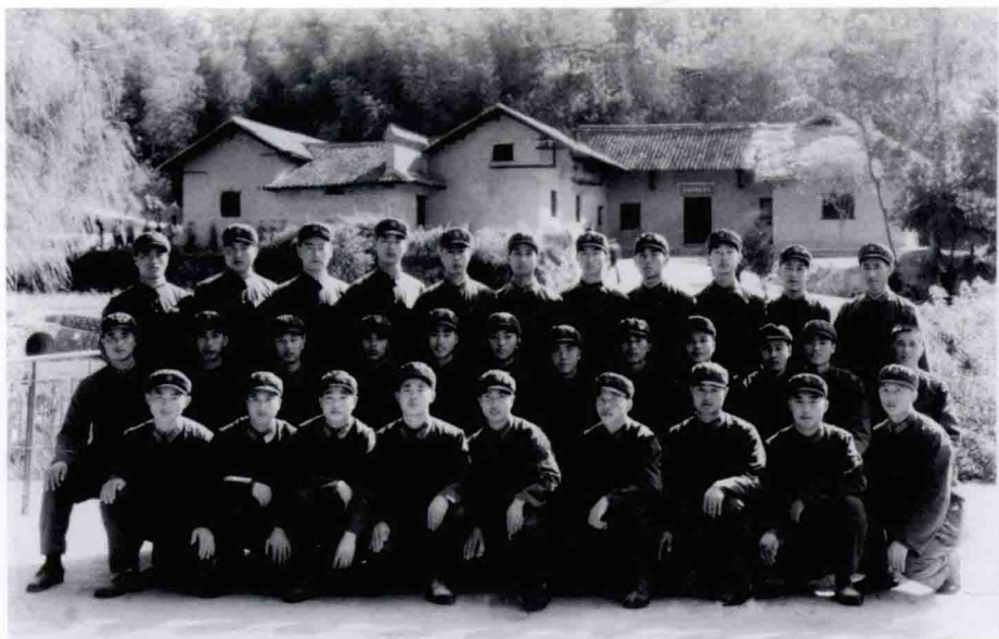
1975年，靳占忠保卫毛泽东主席南下，在韶山毛泽东故居与战友留影