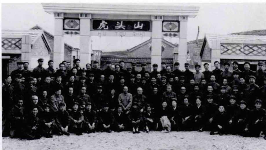
1977年，靳占忠保卫叶剑英元帅视察山西大寨