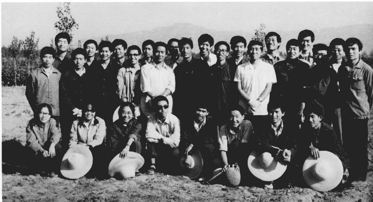
参加1984年发掘工作的辅导老师和81级部分同学、82级全体同学及山西省考古研究所工作人员合影