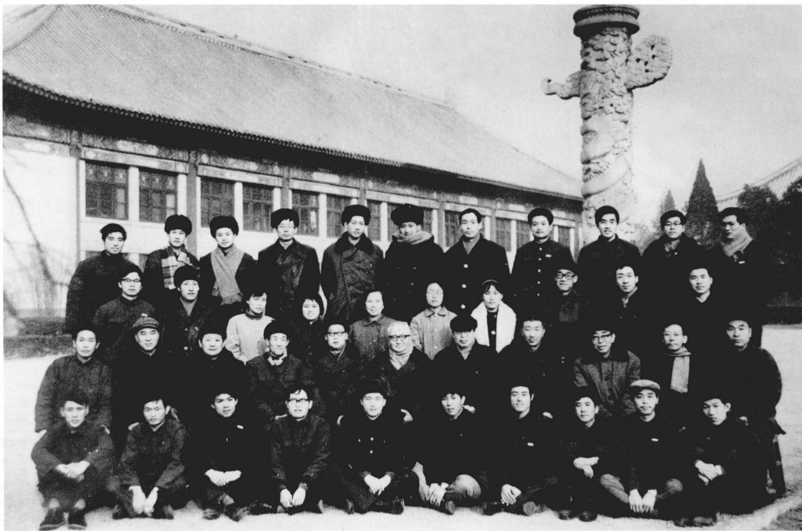
参加1980年发掘工作的部分教师与77级全体同学合影（下注为参加发掘人员）